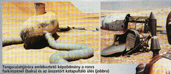
Tengeralattjáróra emlékeztető képződmény a roncs farkrészénél (balra) és az összetört katapultáló ülés (jobbra)