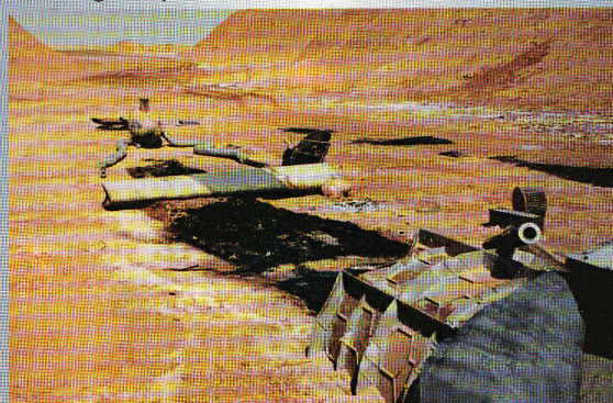
A forgatás kedvéért készült: egy lezuhant repülő a sós pusztá peremén

A hermetikusan elzárt forgatási területtől öt kilométerre nyugatra belebotlottunk az úgynevezett „Anni Location”-be, a harci jettek temetőjébe. Bizarrr látványosság a sivatag közepén