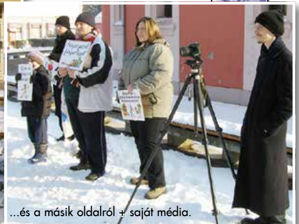
...és a másik oldalról + saját média.