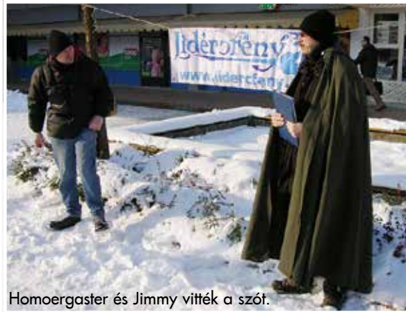
Homoergaster és Jimmy vitték a szót.