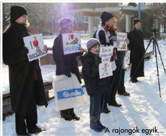
A rajongók egyik...