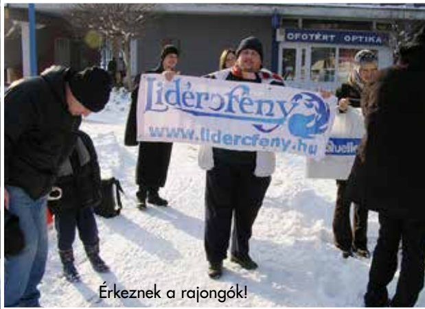
Érkeznek a rajongók!