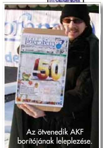
Az ötvenedik AKF borítójának leleplezése.

Ida, a versmondó lány szerepében a kultikus "Békaélet Békaréten" című remekművet olvasta fel.