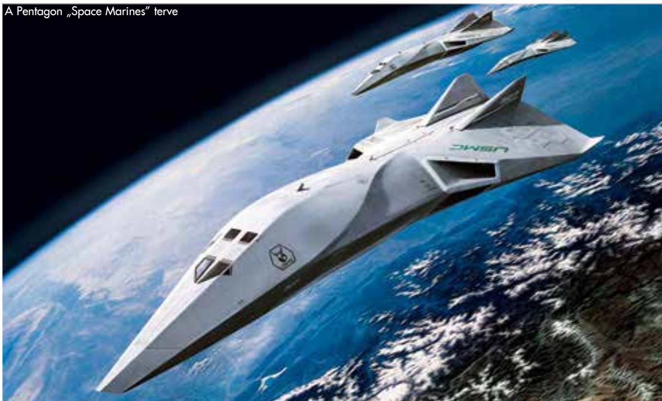
A Pentagon „Space Marines” terve