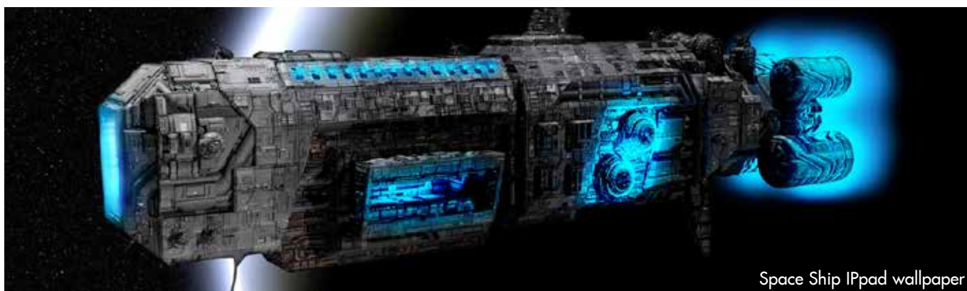
Space Ship IPpad wallpaper