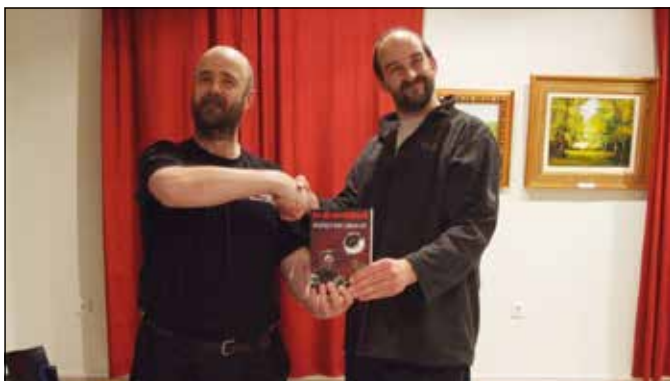
Elmerik boldogan veszi át a novelláskötetet Kapitánytól.