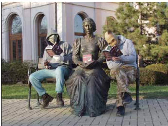
Dezső a zombi és a Rejtelmes Túlélő a róluk szóló novelláskötetet olvassák a szentesi könyvtár épülete előtt. Ja, meg van ott valami szobor is. :)

Nem sokkal a megjelenés után Homoergaster elkezdett szervezni egy könyvbemutatót a Szentés Városi Könyvtárban. A könyvtár vezetése nyitott volt a dologra, mi több, küldött ki