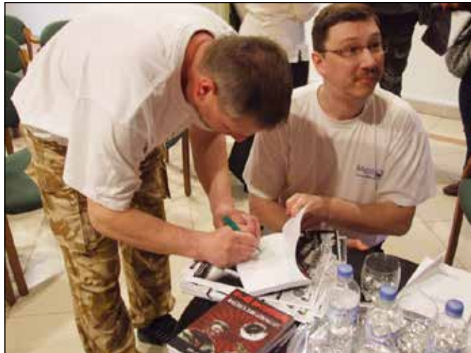
Aztán dedikálni is kellett.

Mindezzel viszont még nincs vége a kötet szárnyalásának, ugyanis az internetes megjelenés után nem sokkal megkeresett bennünket a fapadoskönyv.hu oldal kiadóvezetője, hogy látunk fantáziát a kötet nyomtatott kiadásában, s szeretnék, ha tárgyalnánk erről. Miután a kiadóvezető a következőket írta: „Először is köszönöm az élményt, amit az ingyenesen letölthető