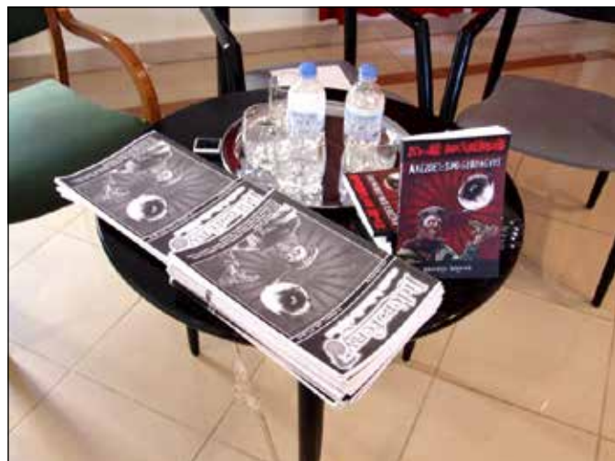
Az asztal elkészült a könyvbemutatóhoz.