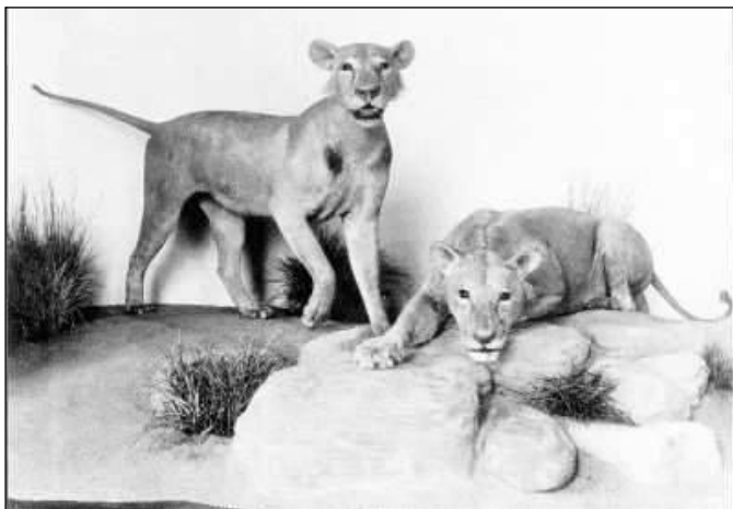
A tsavoi emberevők a múzeumban.

riad, Remington sátrát szétdőlvén találja, a vadász maradványait pedig szétkenve a szavannán. Elborultan, gyászolva felgyújtja a fűvet. Az emberevő hamarosan rátámad az ezredesre, akinek az utolsó pillanatban sikerül megölnie, dühöngő szörnyet. A film végén teljes biztonságban találkozhat a feleségével, és fiával. A Chicagói Field Museumba került állatok megtekinthetők ma is, és a szemükbe nézve még mindig rettegés érez a látogató.