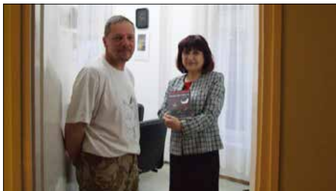
A könyvtár sem maradt Zombi Apokalipszis nélkül.