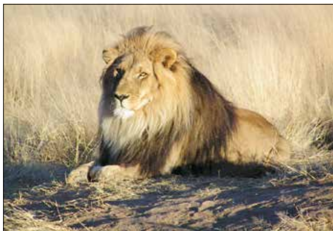
Királyi méltóság és nyugalom.