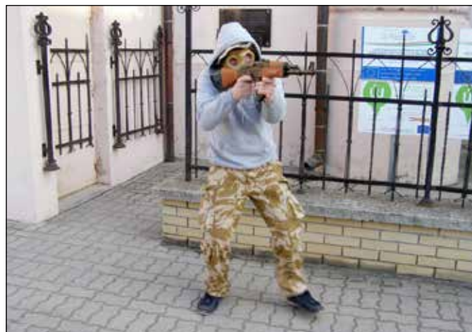
Homoergaster zombit i(í)rt.