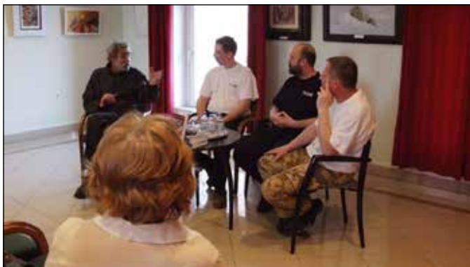
Poszler tanár úr kérdez.