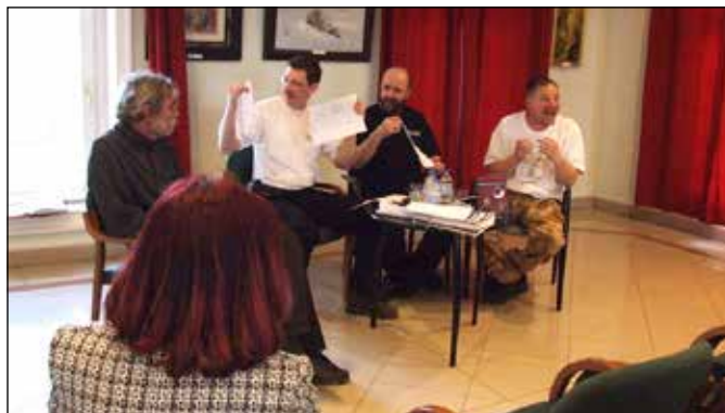
Igyekeztünk folyamatosan aktívak lenni. :)