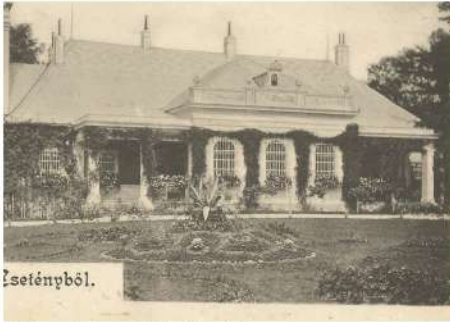
Előkert képe 1890 előttről