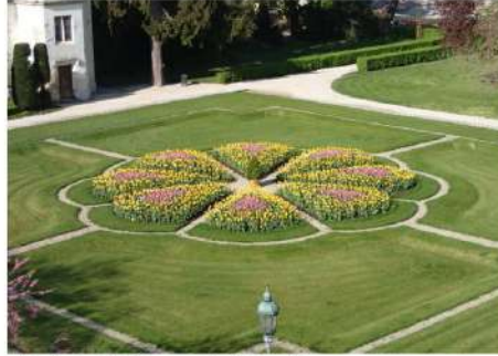
'Virág' alakú intenzív kiültetés