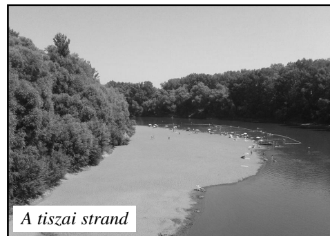
A tiszai strand

aggodalomra akkor sincs semmi ok! Bejárható-biciklizhető közelségben látnivaló sokasága kínálja magát. Itt van mindjárt a "Mezítlábas Notre Dame"- ként emlegetett tákosi paticsfalú templom, vagy