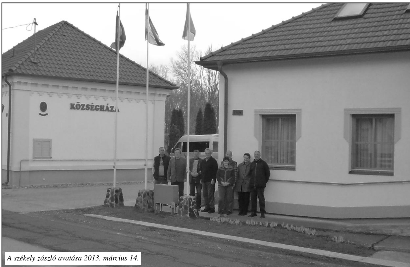
A székely zászló avatása 2013. március 14.