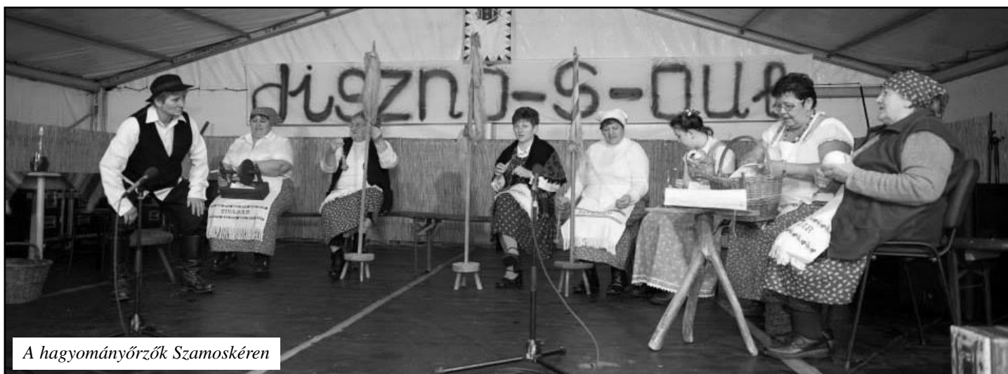
A hagyományőrök Szamoskéren