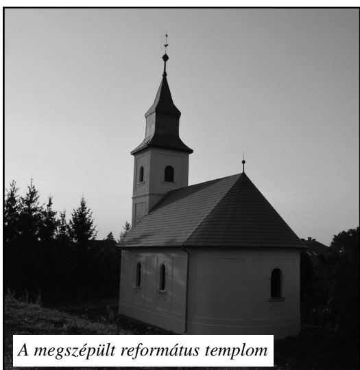
A megszépült református templom