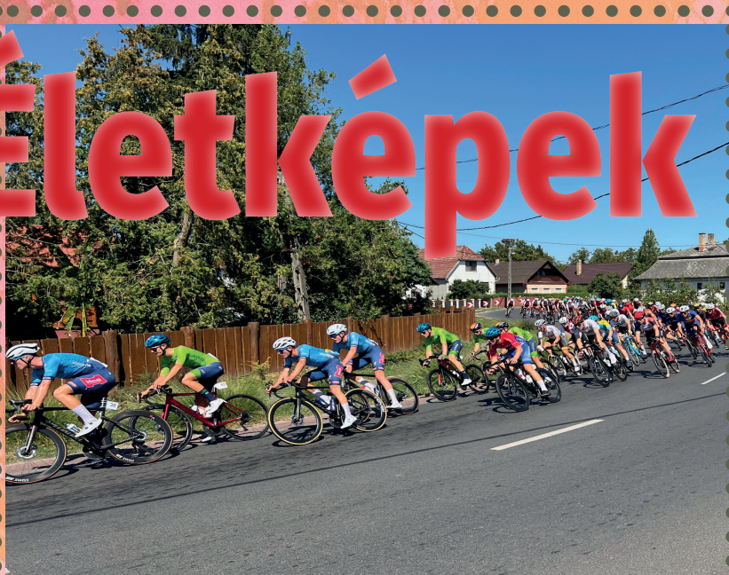
Az ifjúsági világkupa kerékpárverseny Tivadaron is áthaladt.