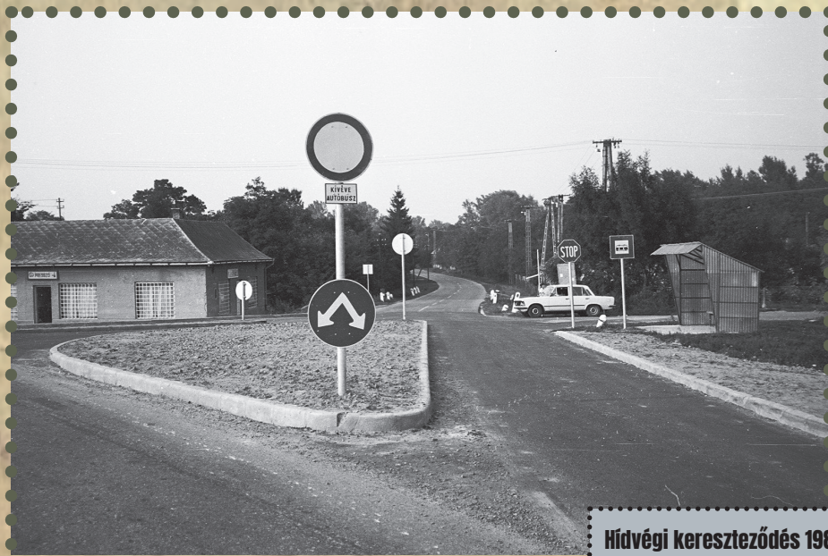
Hidvégi kereszteződés 1983