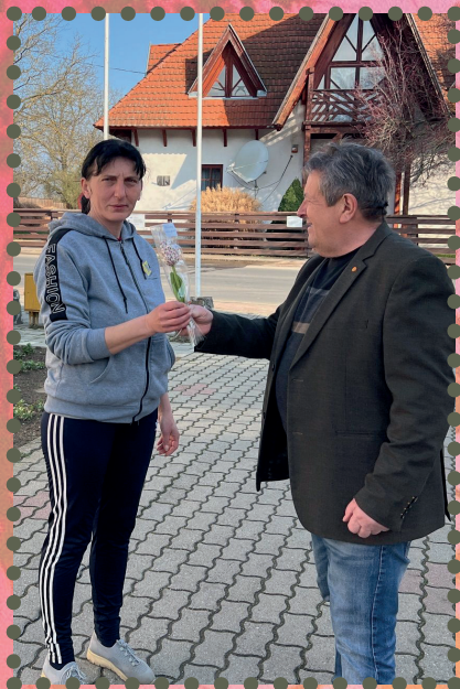
A hölgyek köszöntése Nőnap alkalmából