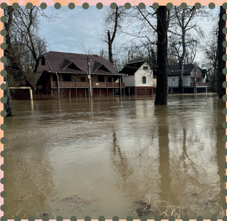
2024. februárjában kisebb árhullám előntötte az üdülő övezet.