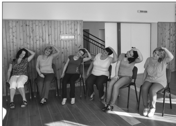
A hivatal dolgozói is részt vettek a megmozduláson

A főrendező szavainak idézetével, tisztelettel megköszönjük a kiemelkedő részvételt Úrhida minden lakosának, a sporttal töltötte ez a kánikulai napot.