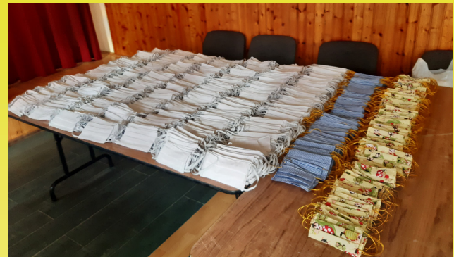
Önkéntesek felajánlásának köszönhetően minden 6 év feletti lakosnak tudunk biztosítani a többször használatos szájmaszkat.

gatásának felfüggesztése mellett döntöttünk. A vészhelyzet megszűnésével folyamatban van egy alacsony költségvetésű elsősorban a gyermekek szórakoztatására szervezett program előkészítése augusztus, esetleg szeptember hónapban.