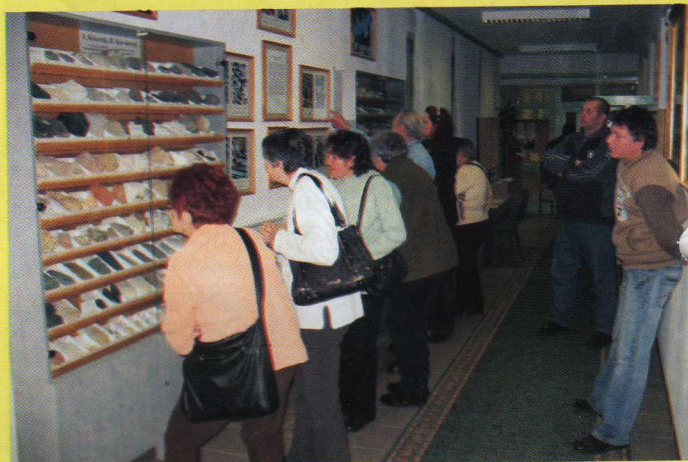
A Múzeumbarátok Köre tagjai középiskolánk vendégei voltak