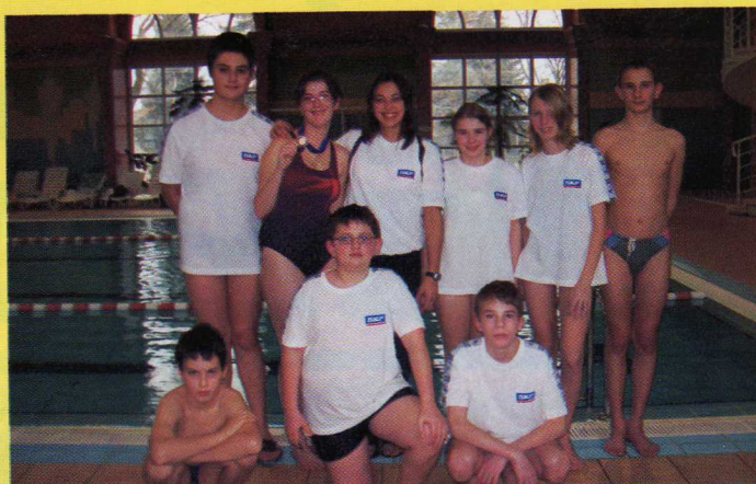
Gratulálunk úszóinknak az elért eredményeikhez!