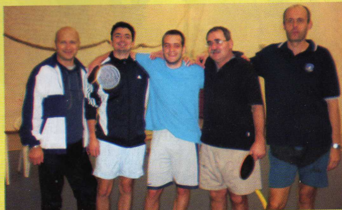
Szeghalmi asztalitenisz verseny ványai sikerekkel - Gratulálunk!