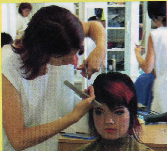
Félévi szakmai vizsgák a Farkas Gyula Közoktatási Intézményben