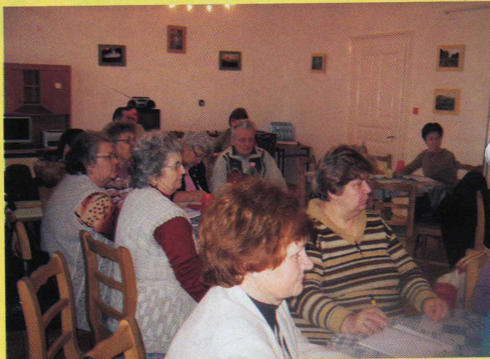
Civil kerekasztal Dévaványán, a Civilházban