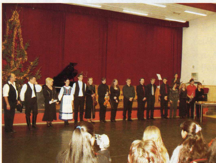
BÚÉK 2009 -Nagy sikert aratott a művészeti iskola újévi koncertje