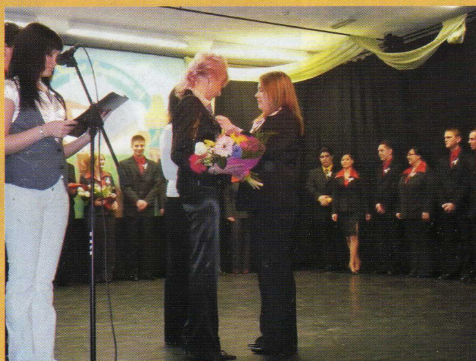
A középiskolások szalagavatója - 2009. február 27.