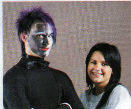
Kiskunfélegyházi fodrásztanuló-verseny - 2009. március 8.