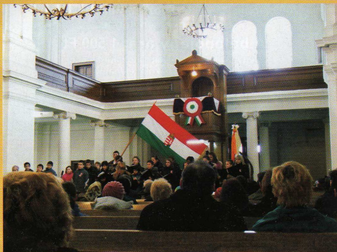
Városi ünnepség – 2009. március 15.