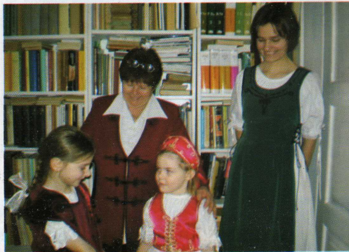
Új kiállítás nyílt a múzeumban – 2009. március 7.