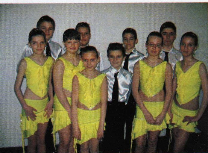
VI. Szabolcs-MCOnet Magyarország Társastánc Fesztivál – Gratulálunk az elért eredményhez!