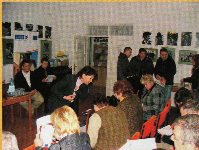
Kistérségi vállalkozói fórum volt Dévaványán