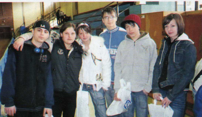
Középiskolai Közlekedésbiztonsági Kupa Szarvason – 2009. március 20.