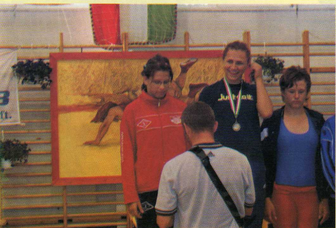
Birkózóink újabb sikereket értek el. Gratulálunk!