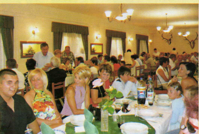
A Dévaványai Nők Baráti Köre ünnepi vacsorát rendezett