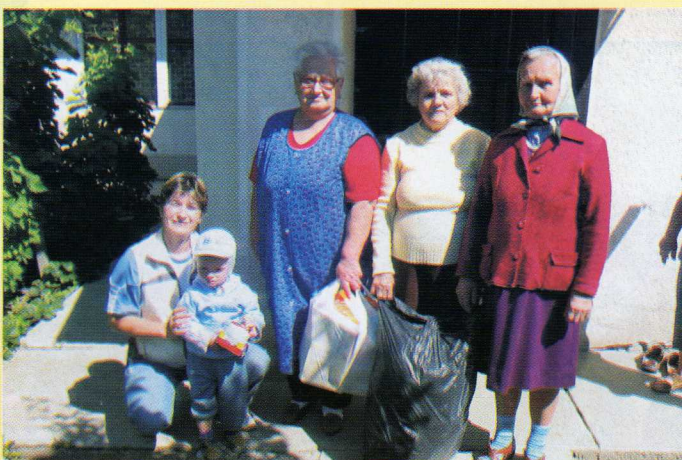
Segélyáru szétosztása Dévaványán