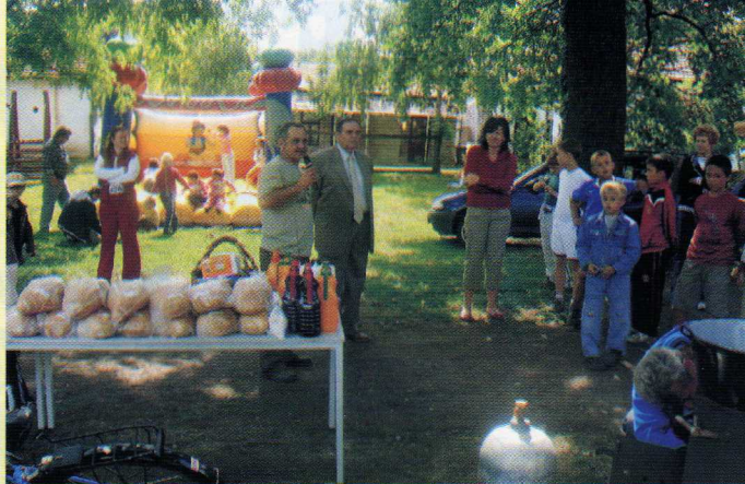
Gyermeknapot tartott a Nagycsaládos Egyesület