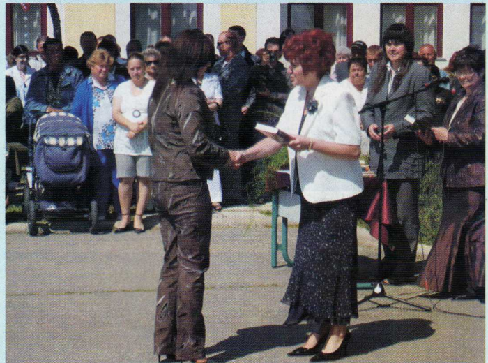
Ballgás a középiskolában - 2009.