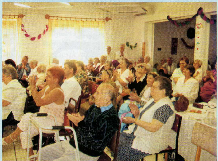
Kulturális Találkozó a Margaréta Idősek Otthonában