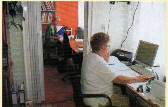
Kotálík Kft. Dv., Móricz Zs. u. 25/3. Könyvelőiroda, klímaberendezések szerelése-javítása. 06-66/483-336