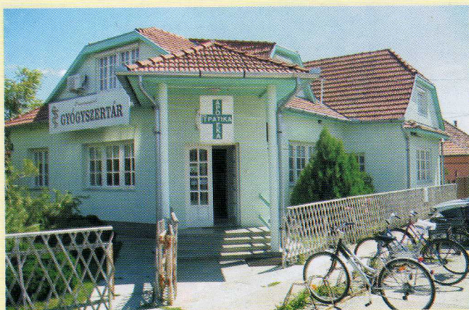
Órangyal Patika Dv., Kör u. 1. Ct.: Szilágyi István