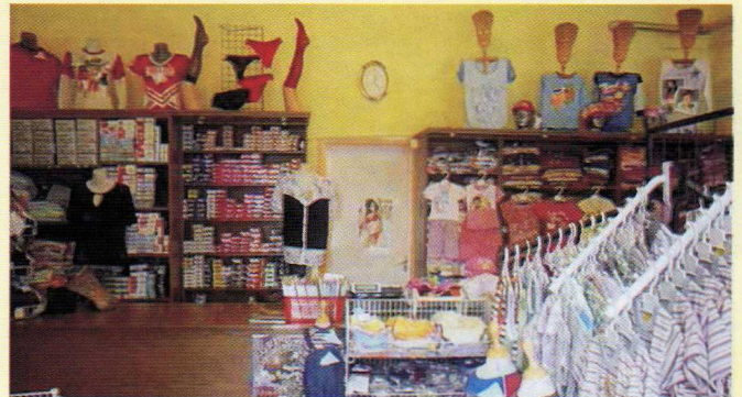
Gyermekruha, fehérnemű, divataru üzlet Dv., Árpád u. 16. Ct.: Bak Imréné. Főleg magyar készítésű gyermekruhát árulok, valamint jó minőségű fehérneműt, harisnyát és női felsőruházatot.