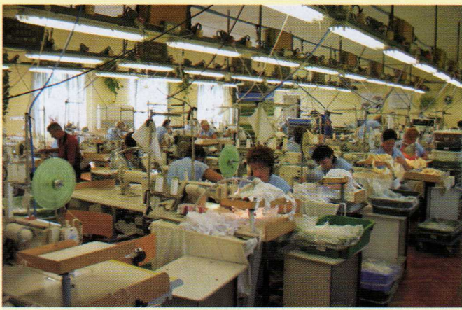
Felina Hungaria Kft. Dévaványai telephelye, Dv., Móricz Zs. u. 31. Fehérneműk gyártása