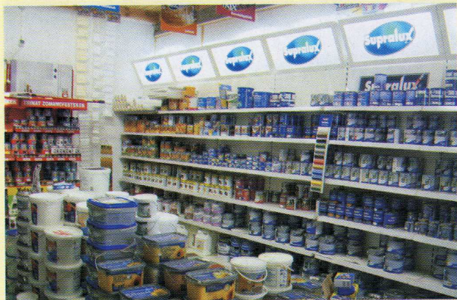
Mezőgazdasági Bolt Dv., Széchenyi u. 28. Ct.: Csaba Jánosné