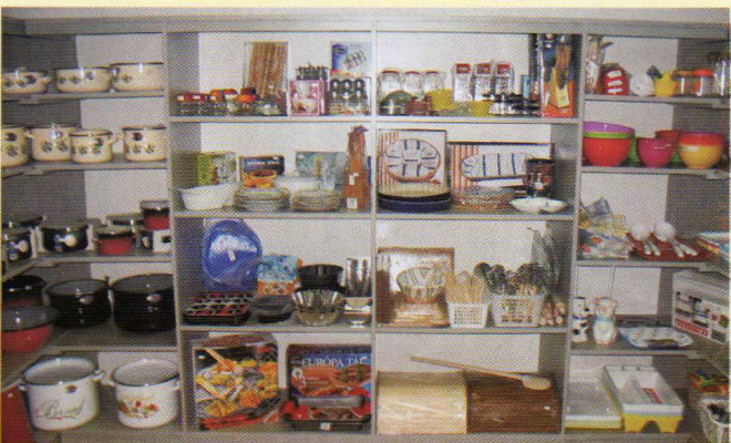
Újra megnyílt a konyha stúdió! Dv., Hősök tere 3. A már megszokott kínálattal edények, pohárkészletek, ajándéktárgyak