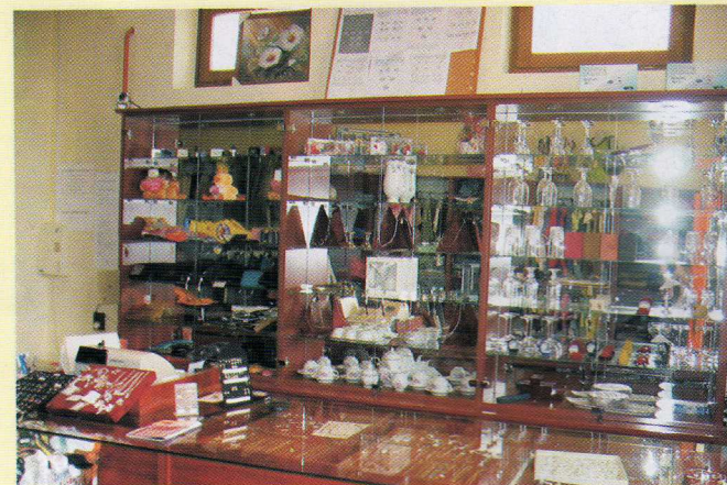
Óra, ékszer, ajándék Dv., Árpád u. 24. Női, férfi, gyermek divatáru, sportruházat.