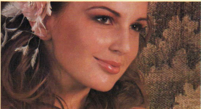
Izabell Esküvőiruha Szalon Dv., Árpád u. 27. A 25 éves Izabell Szalon töretlen energiával segíti a menyasszonyokat a legszebb napjuk fényének emelésében. 06-66/484-123 www.izabell.hu