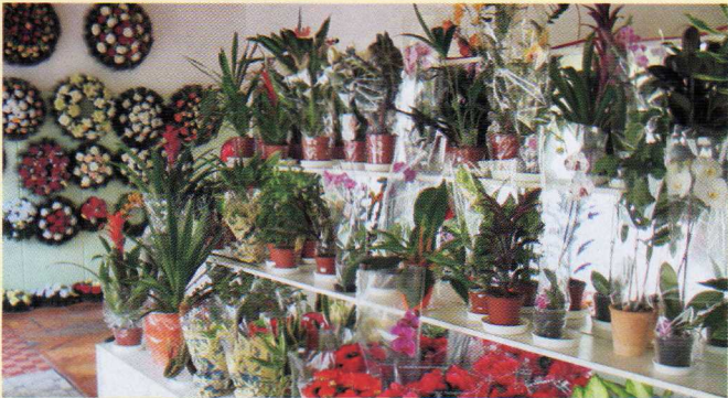
Frézia virágüzlet Dv., Bem u. 1. Üzletünkben forgalmazunk vágott és cserepes virágokat, élő és műkoszorúkat, virágápoláshoz kapcsolódó termékeket, valamint kerámiákat, ajándéktárgyakat.