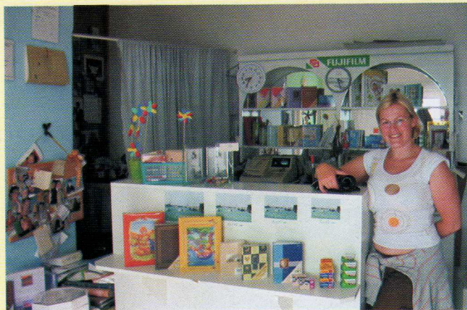
Lovász Judit Fényképészet Dv., Bem u. 2. Minden ami fotó - „Megpróbálom maradásra bírni a múlt időt.”