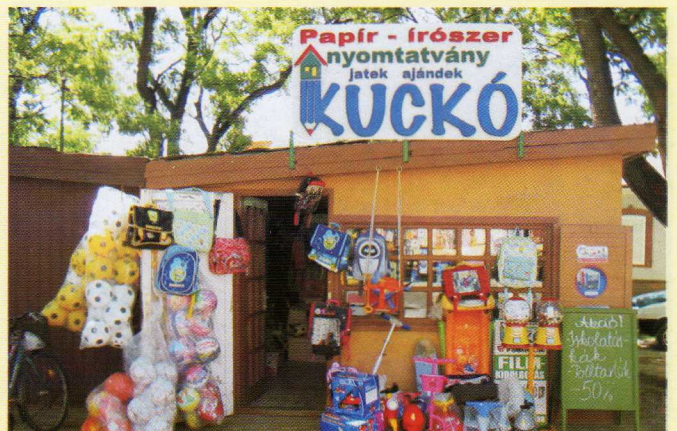
Kuckó papír, írószerszámok, ajándék Dv., Hősök tere 1. Szeretettel várjuk kedves vásárlóinkat!