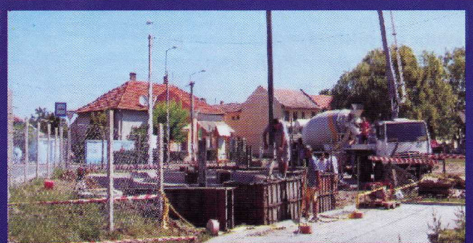
A projekt az Európai Unió támogatásával, az Európai Regionális Fejlesztési Alap társfinanszírozásával valósul meg.

UmFT infonovatal: 06 40 638 638 mfgmsh.hu www.uma.hu