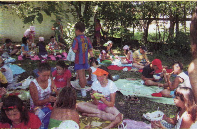
Szomszédolás Látogatás Romániába - múzeumi gyermektábor 2009.