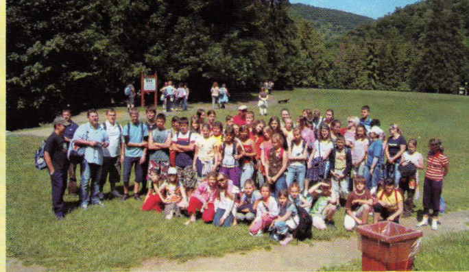
A Művészeti Iskola nyári táborának Lillafüredi kirándulása