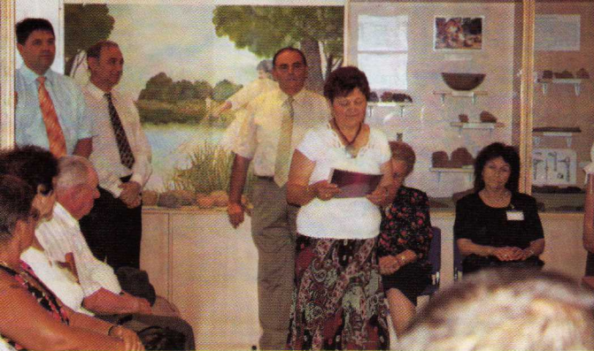
Új kiállítások nyíltak a múzeumban