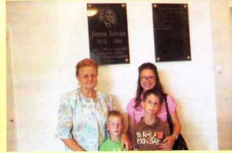
Átadásra került a Seres István Sporttelep - 2009. július 25.