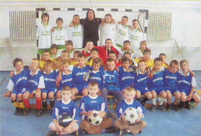
Gratulálunk az ifjú focistáknak és edzőjüknek a szép eredményekhez!