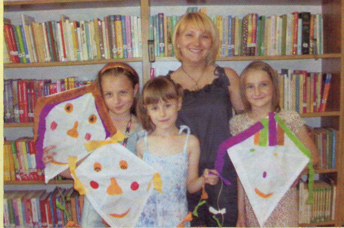
Keddenként 14 órától játszóház várja a könyvtárba látogató gyerekeket