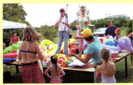
Családi csobbanás 2009.