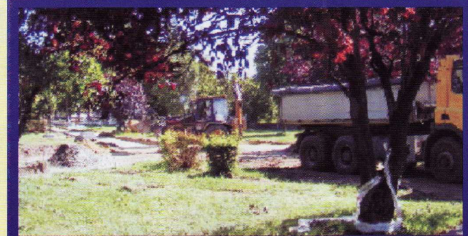
A projekt az Európai Unió támogatásával, az Európai Regionális Fejlesztési Alap társfinanszírozásával valósul meg.

UmFT infonovatal: 06 40 638 638 mfgmsh.hu www.uma.hu