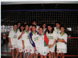
IV. kcs. kézilabda megyei elődöntős csapat