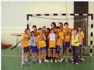
kézilabda III. kcs körzeti győztes csapat