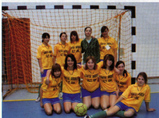
Leány foci Farsang kupa III. hely Szeghalom