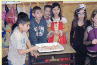
Farsangoltak a Szügyi Dániel Ref. Ált. Isk. tanulói