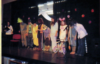
Nagy sikert aratott a Farkas Gyula Közoktatási Intézmény Alapítványi Estje - 2010. február 13.