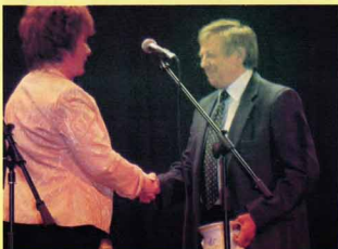
Mecénás Díj átadó gála - 2010. március 13.