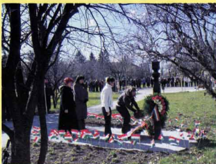
Megemlékezés - 2010. március 15.