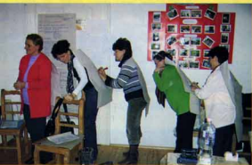
Kapocs Egyesület - lehetőségeink és korlátaink - pályázattíró tréning