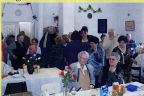
Nőnap ebéd az Őszi Napfény Nyugdíjas Klubban