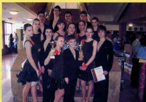
Gratulálunk a művészeti iskola növendékeinek!