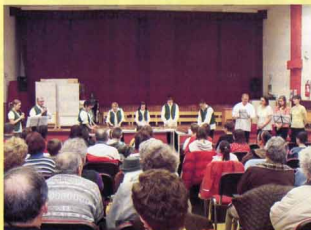
“Dallal - citerával” est