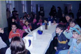
Február 26-án „Iskola hívogató” rendezvény volt a Szügyi Dániel Református Általános Iskolában