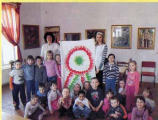
Kokárdát készítettek az óvodások a múzeumban