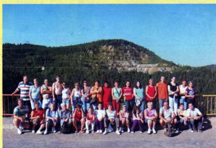
A nagycsaládosok Erdélyben kirándultak