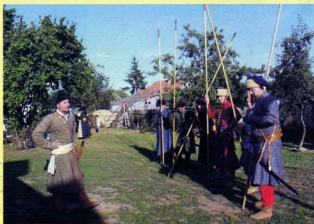
Kurucz portya augusztus 20-án a Dózsa György utcában