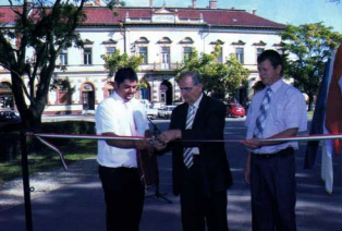
Déaványa város közúthálózatának fejlesztése - Az utak átadása, 2010. augusztus 27.