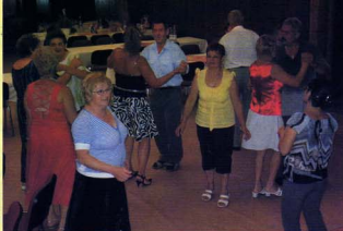
A Békés Megyei Nők Egyesülete Déaványai Szervezetének éves vacsorája