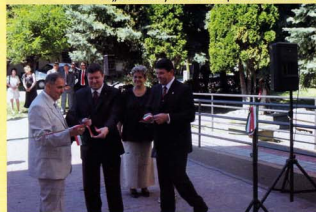
A Ványai Ambrus Általános Iskola épületének ünnepélyes átadása