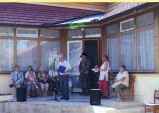
A kuruc kori emlékek kiállítás megnyitója a múzeumban