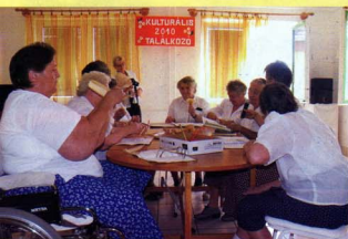
Margaréta napok - 2010. augusztus 26-28.