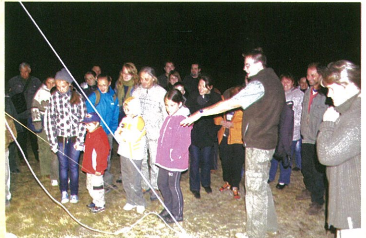
„Csillagösvényeken” jártak a Madárbarátok Köre tagjai