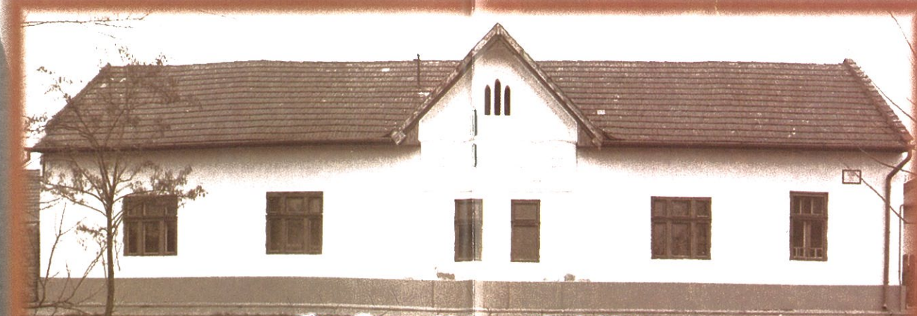
Dr. Bereczki Imre Emlékház