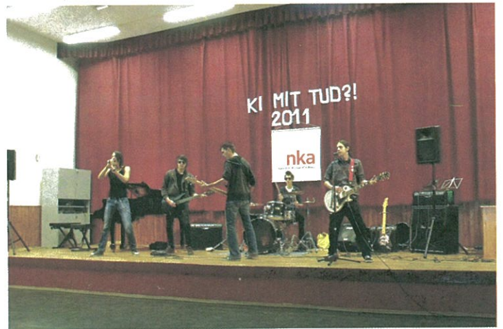
Sok résztvevővel zajlott le a térségi Ki mit tud?