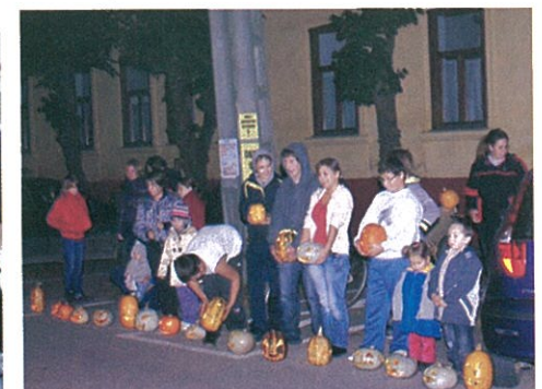
Töklámpásokat készítettek a Nagycsaládos Egyesület tagjai október 31-én