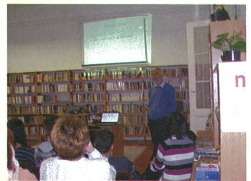
DÉKE Környezet és egészség előadássorozata