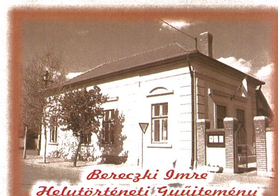
Bereczki Imre Helytörténeli Gyűjtemény