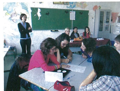
Nyílt napot, és nyelvi versenyt tartottak a középiskolában