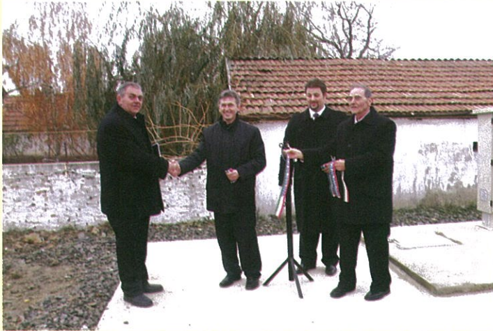
Befejeződött a „Dévaványa Szennyvízberuházásának megvalósítása” - KEOP 1.2.0/2F/09-2010-0006 azonosítószámú beruházás

DÉVAVÁNYA VÁROS ÖNKORMÁNYZATA TÁJÉKOZTATÓ LAPJA