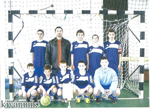
Labdarúgóinknak gratulálunk, további sikereket kívánunk!