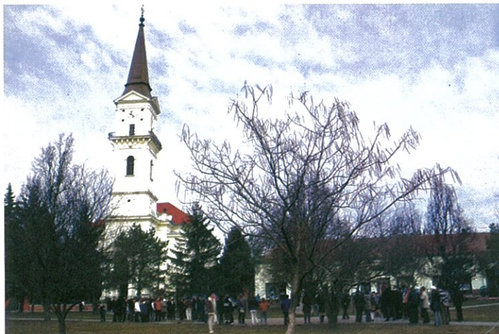
Ünnepi megemlékezés 2012. március 15.