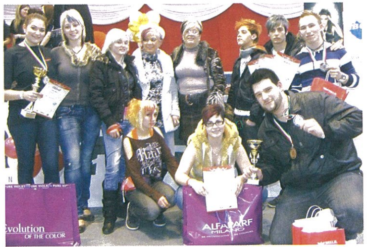
Újabb fodrász sikerek gratulálunk!