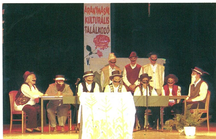
A Borostyánkert Otthon lakói Dévaványán és más települések kulturális rendezvényein is sikerrel szerepelnek