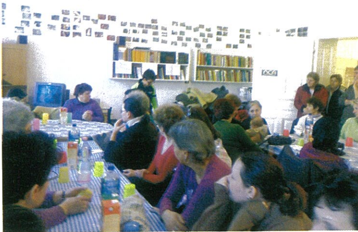
Nőnapot rendeztek a nagycsaládos egyesületben