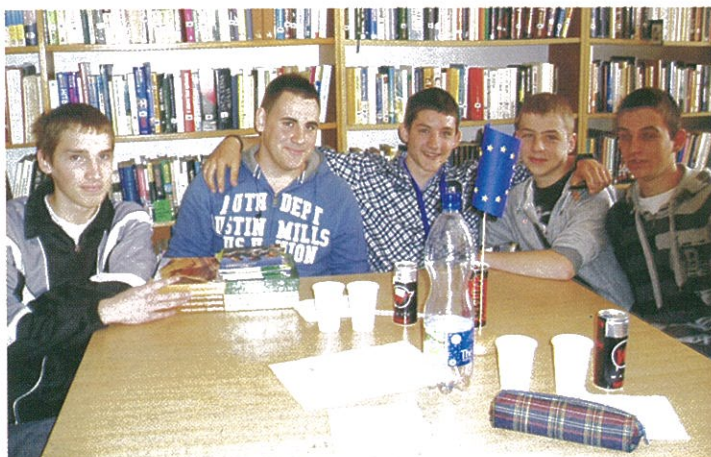
Uniók vetélkedő győztes csapata a könyvtárban: a dévaványai középiskola tanulói