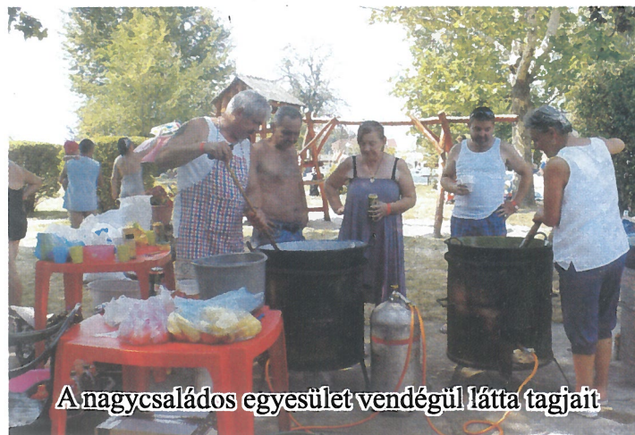
A nagycsaládos egyesület vendégül látta tagjait