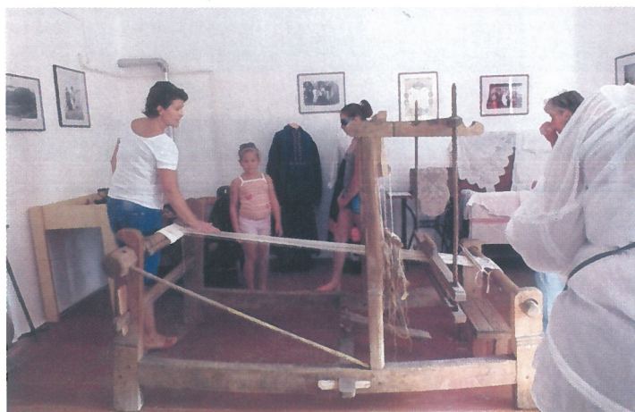
„Fontam, fontam én mindig...” címet viselő textil kiállítás nyílt a Bereczki Emlékházban