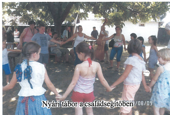
Nyári tábor a családsegítőben /08/09