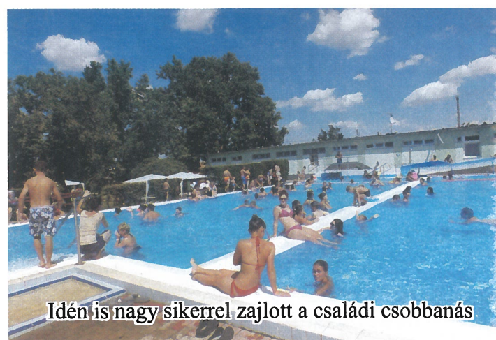
Idén is nagy sikerrel zajlott a családi csobbanás