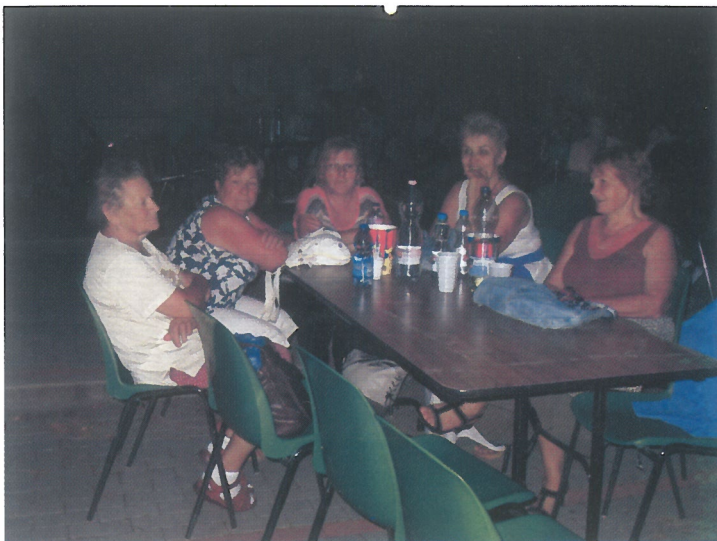
Szabadtéri bál várta a mulatni vágyókat augusztus 19-én