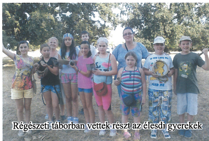
Régészeti táborban vettek részt az élesdi gyerekek