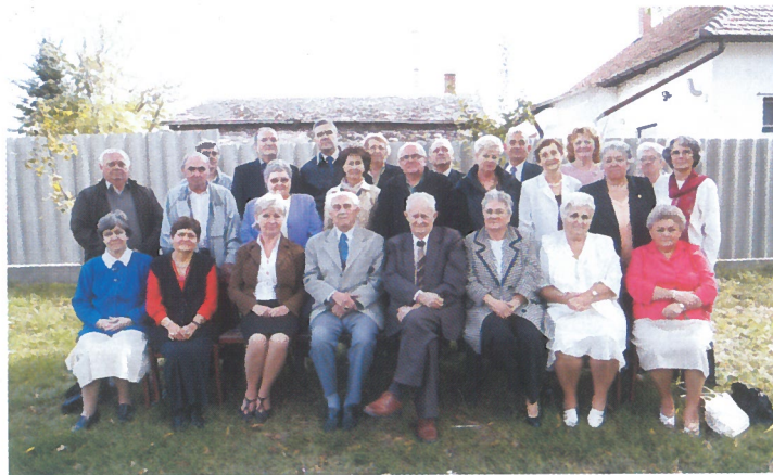
„Emlék időző percek, órák” 45 éves érettségi találkozó a Tisza Kálmán Közoktatási Intézményben