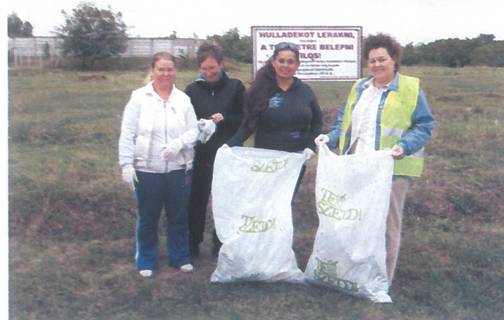
Idén szeptember 14-én ismét megrendezésre került a TeSzedd.