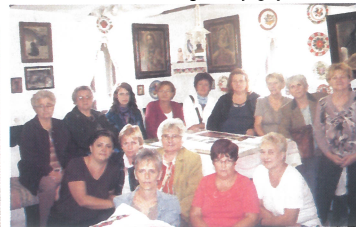
A művelődési ház szervezésében 15 fő, csoportos kiránduláson vett részt Mezőkövesden