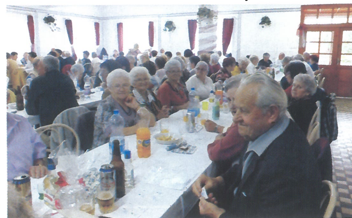
Az Őszi Napfény Nyugdíjas Klub vendégül látta Köröstarcsa és Ecsegfalva nyugdíjasait