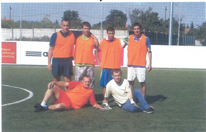
Első alkalommal került megrendezésre a Borostyánkert Otthon lakói és dolgozói számára a Borostyán „Liga”