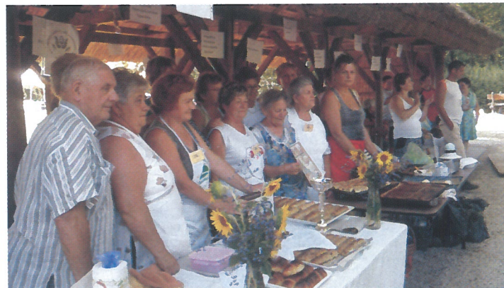
A Hagyományörző Nők Egyesületének tagjai nagy sikert arattak a kürtöskalácsukkal, lekváros kiflijükkel, a sárréti ízek főzőversenyén