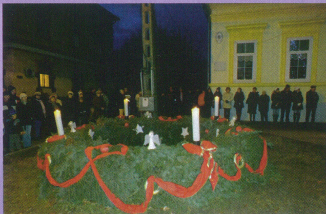
Advent mind a négy vasárnapján gyertyagyújtásra került sor. Köszönet a város valamennyi óvónőjének a csodálatos koszorú elkészítésért!