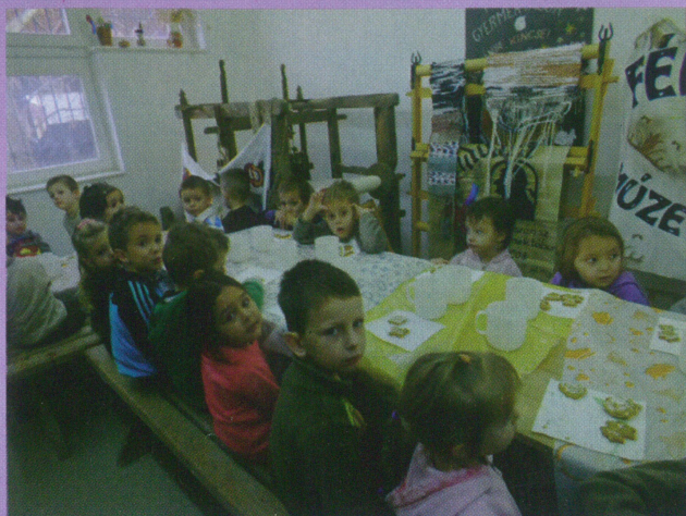
Mézeskalács fesztivál a múzeumban

Lapzárta: 2014. január 27. Következő megjelenés: február 7.