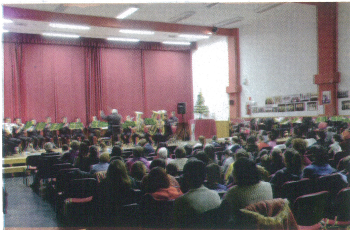
Adventi segélykoncertet tartottak a ványai nagy családokban élő gyermekek karácsonyának szebbé tételéért.