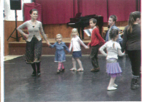
Karácsony havi családi táncházat tartottak a Dévaványai Folkműhely Egyesület szervezésében.