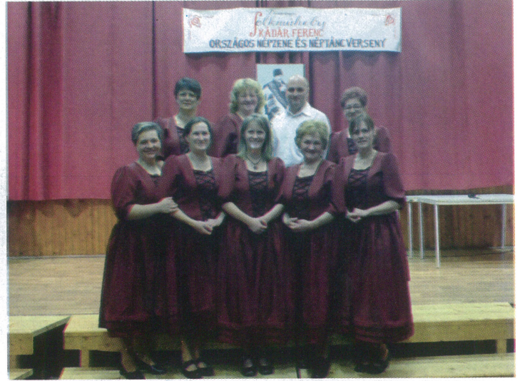
December 8-án került megrendezésre Dévaványán a III. Kádár Ferenc Országos Népzene és Néptáncverseny