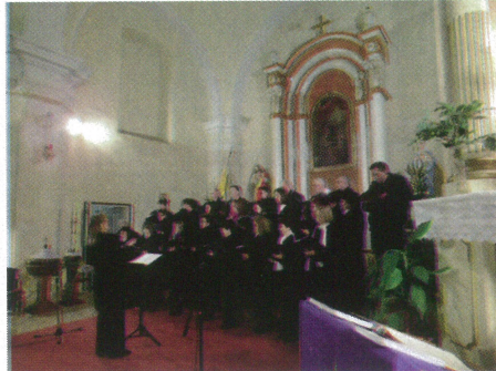
A Vox Humana Vegyeskar karácsonyi koncertet adott a katolikus templomban