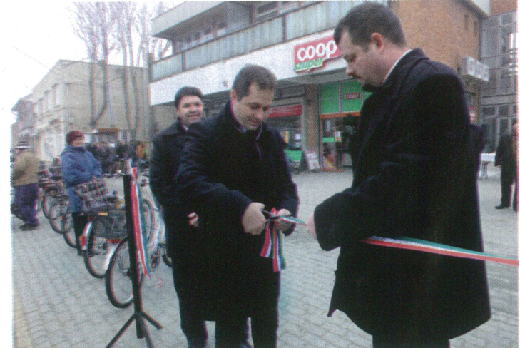
Kerékpár út átadása - 2013. december 20.