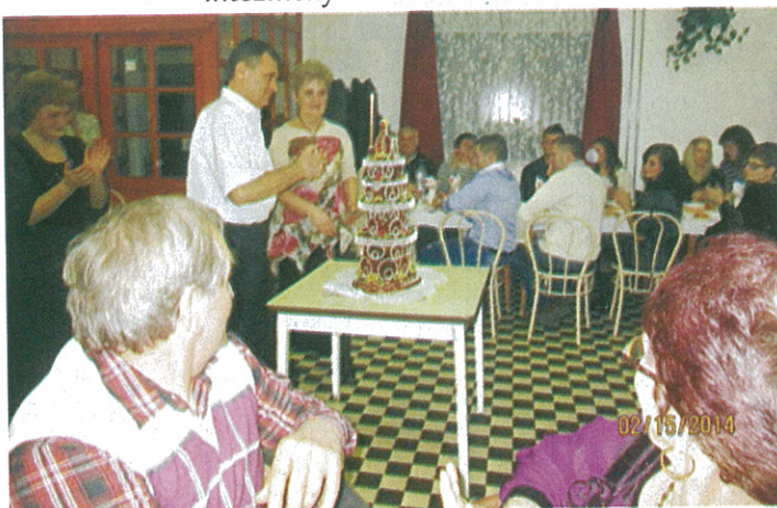
15 éves a Dévaványai Hagyományőrző Nők Egyesülete