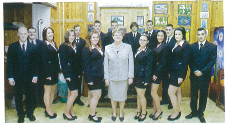
A Tisza Kálmán Közoktatási Intézmény végzőseinek szalagavatója