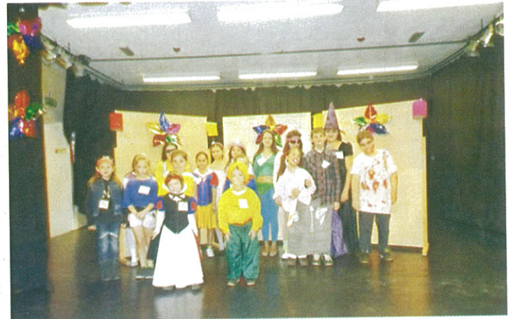
Idén első alkalommal került megrendezésre a művelődési házban a városi farsang