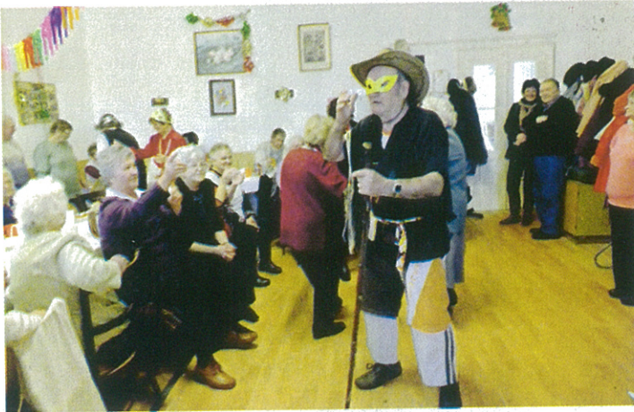
Az Őszi Napfény Nyugdíjas Egyesület tagjai farsangi hangulatban