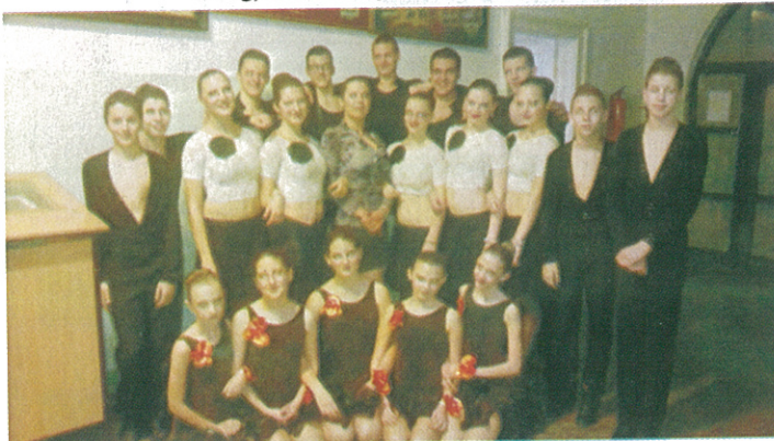
Szeghalmon a III. Tildy Társastánc Versenyen művészeti iskolánk növendékei szép eredményekkel képviselték intézményünket. Gratulálunk!