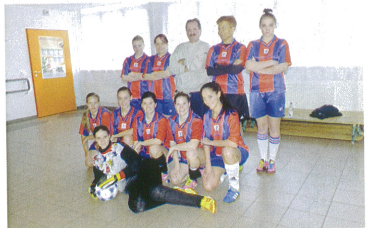
Sárrét Kupa Női Labdarúgó Torna Dévaványán