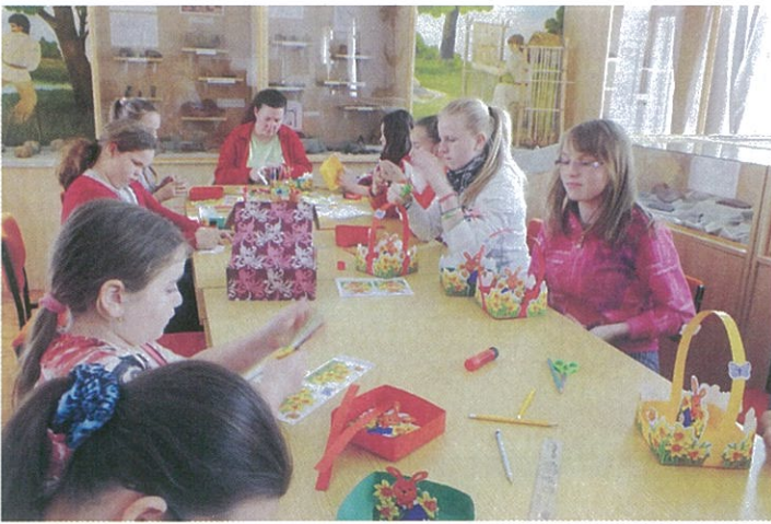
Nagy érdeklődéssel zajlottak a múzeum húsvéti kézműves foglalkozásai