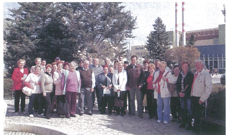
A Paksi Atomerőműben jártak a Dévaványai Hagyományörző Nők Egyesületének tagjai