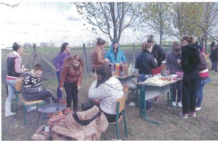
Diáknap a Tisza Kálmán Közoktatási Intézményben