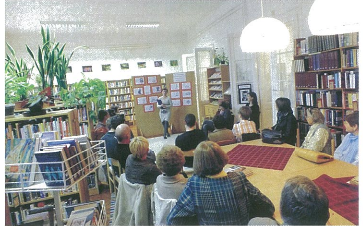
Költészet napja a Ladányi Mihály Könyvtárban