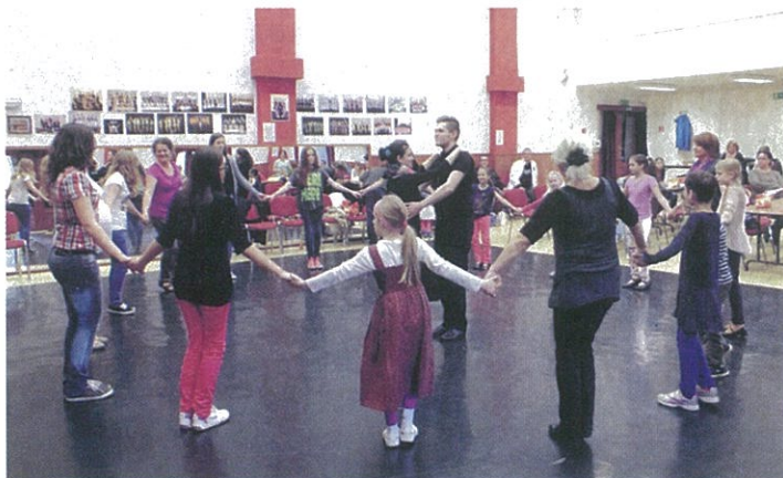
Nagy sikert aratott kicsik és nagyok körében egyaránt a húsvéti táncház