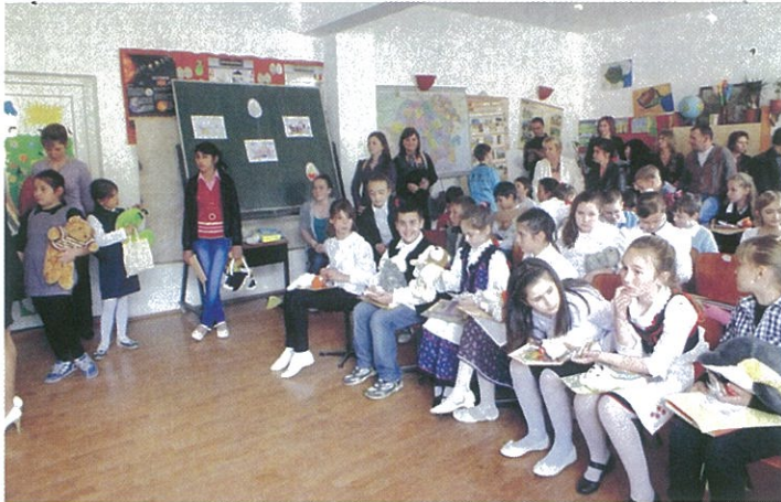
A VI. Lugosi Mihály Megyeközi és Határon átvélő Széppolvasó Versenyen jártak a dévaványai gyerekek a Constantin Serban Elméleti Líceum-ban, Élesden