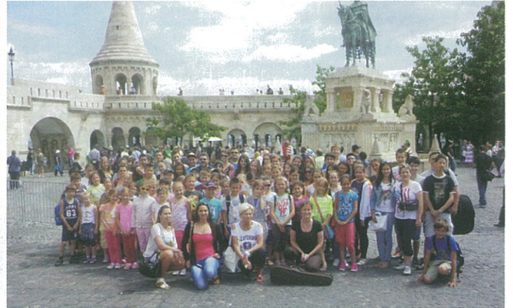
Művészeti Tábor - 2014