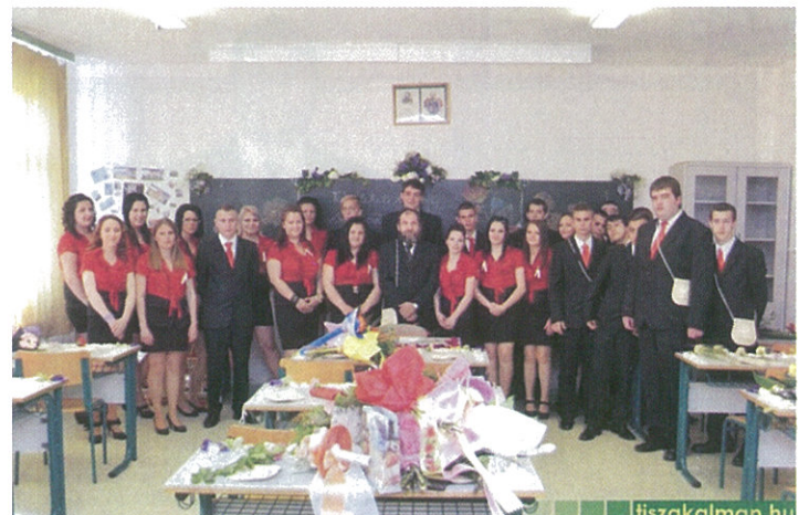
Kiváló eredményekkel zárultak a szakmai vizsgák a középiskolában