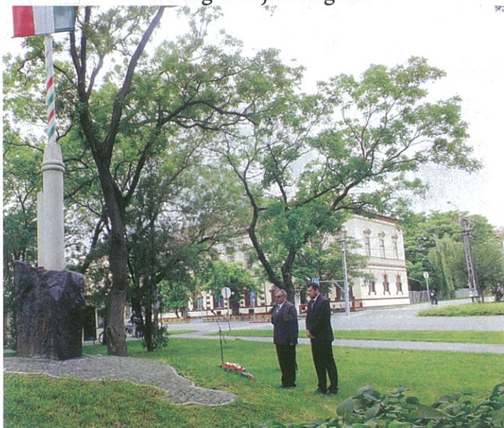
2014-ben is ünnepélyes keretek között emlékeztünk meg Trianonról