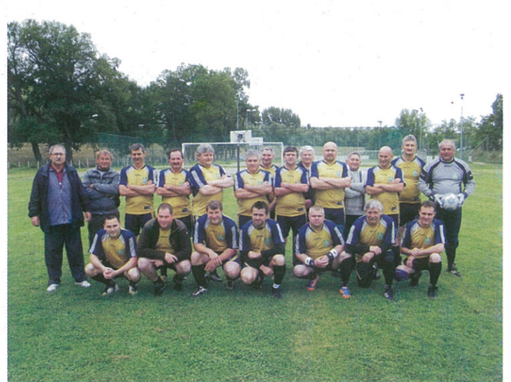
Ismét megrendezésre került a Dévaványa-Körösladány „Öregfiúk” barátságos mérkőzés