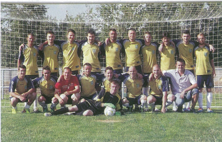
A ványai csapat a második helyet szerezte meg a bajnokságban