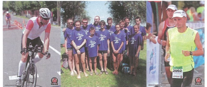
Július 26-án, a 25. nagyatádi ExtremeMan versenyen vettek részt a ványai sportolók