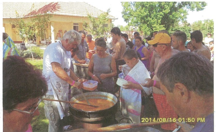
Idén is megrendezésre került a Dévaványai Nagycsaládos Egyesület „Családi napja” a strandfürdőben