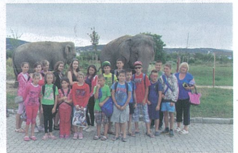
A Ványai Ambrus Általános Iskola diákjai felejthetetlen hetet töltöttek a káptalanfüreden