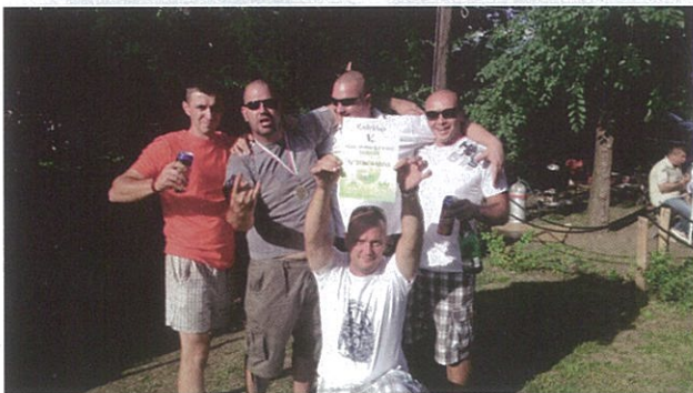
Az V. Birkapörkölt főző verseny I. helyezett csapata. Gratulálunk!