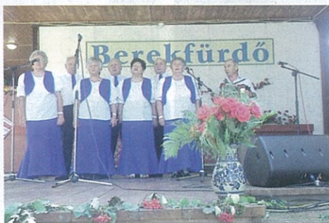
„Az Őszi Napfény Nyugdíjas Egyesület” fellépett Berekfürdőn