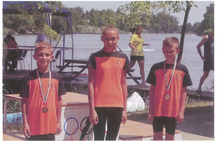
Dévaványai reménységek, KSI Gyomaendrőd kajak – kenu egyesület tagjai.