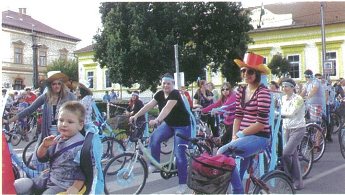
Autómentes nap 2014.