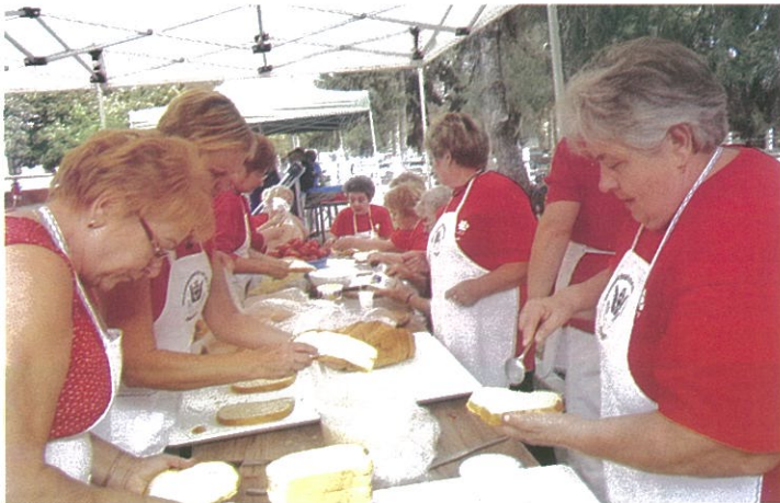
Hagyományörző Nők Egyesülete