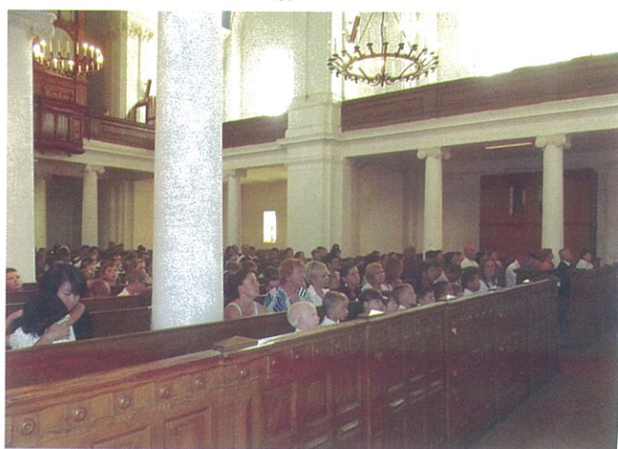
Istentisztelettel egybekötött tanévnyitó a Szügyi Dániel Református Általános Iskolában