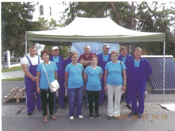
Szociális Szövetkezet működik Dévaványán