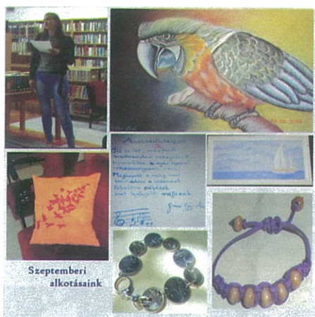
Működik a „Nyitott műhely” a könyvtárban. Szébbnél szebb alkotásokat osztanak meg egymással a kis közösség tagjai