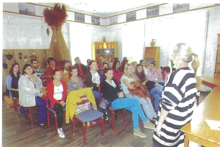
„SÁ-RI” bemutató múzeumpedagógiai óra a helyi középiskolásokkal és Békés megye múzeumvezetőivel