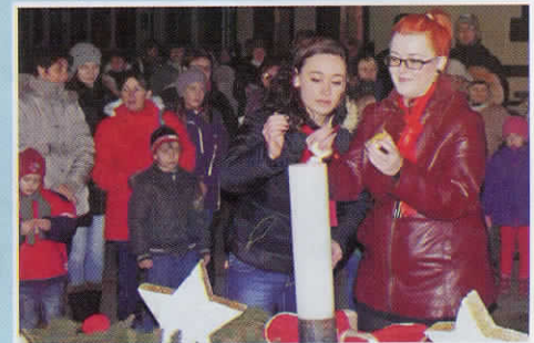
4. Adventi gyertyagyújtás