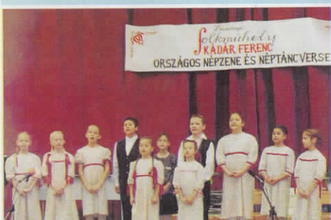
IV. Kádár Ferenc Népzene és Néptáncverseny