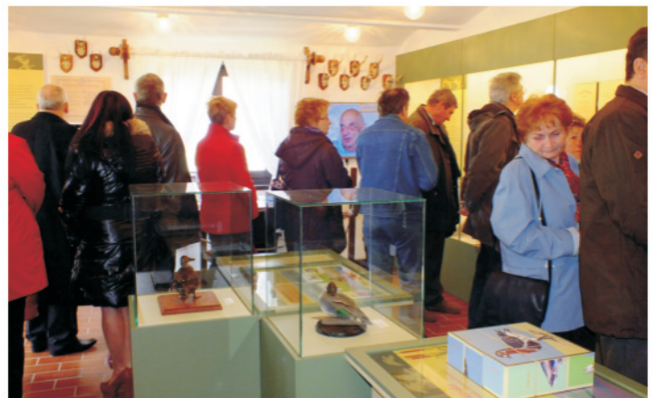
Sterbetz István emlékszoba nyílt a KMNP - Réhelyi Látogatóközpontban