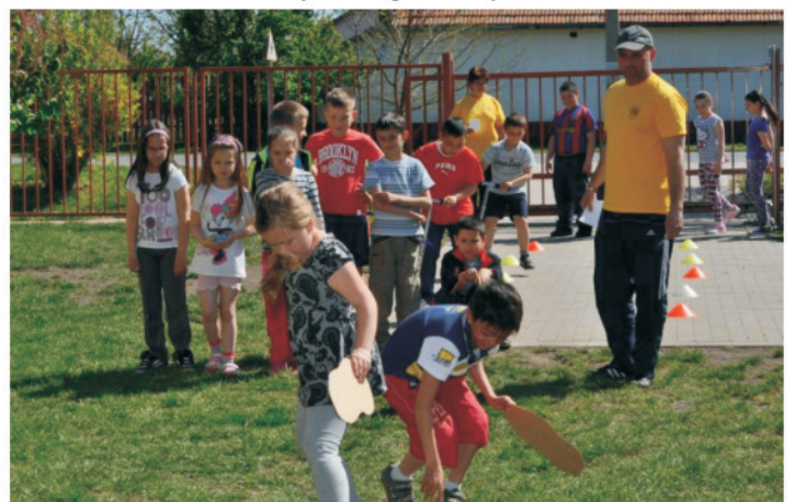
Föld napi akadályverseny a Vass-telepen