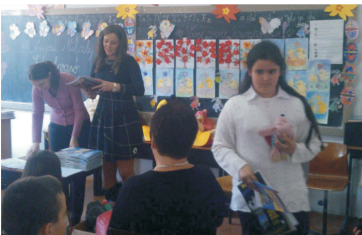
Szép olvasó versenyen jártak a dévaványai diákok a Romániai Élesden