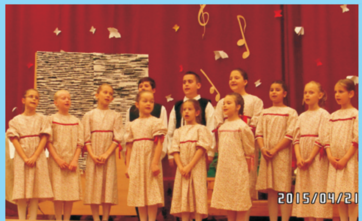
Népzenesi koncert a művészeti iskolában