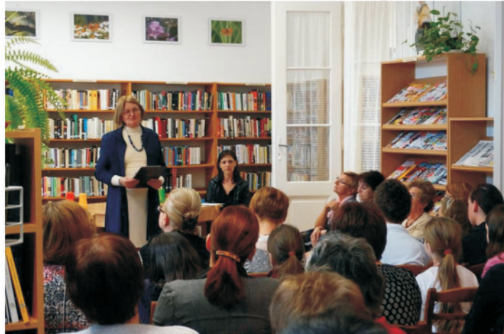
Költészet napja Ladányi Mihály könyvtárban