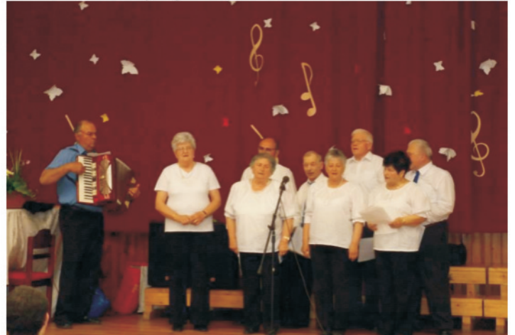
K.I.E.Z blues zenei est a művelődési házban