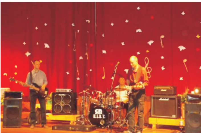
Tavaszcímzés batyusbál a művelődési házban