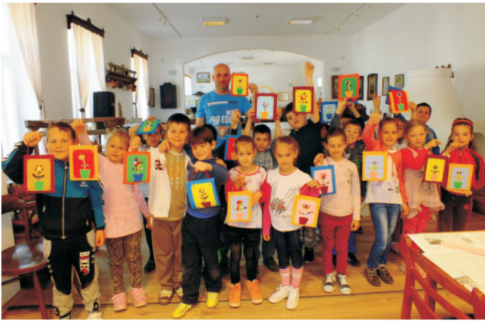
Tavaszcímzés kézműves foglalkozás és mézcsokoládé készítése a SÁ-RI program keretein belül