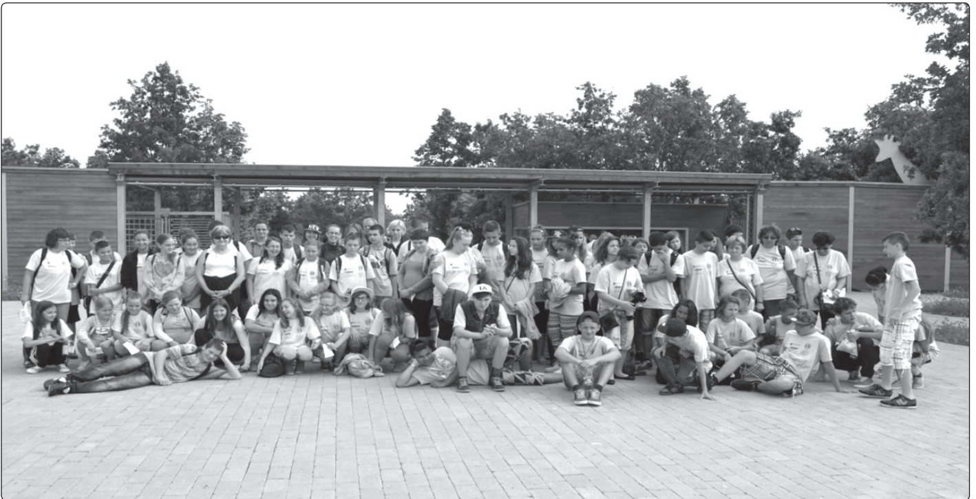
A két testvér iskola– „Ambrus” és „Ágota”

A „Hazai és nemzetközi testvériskolai kapcsolatok kialakítása” című pályázati kiírás 17 000 000 forint visz-