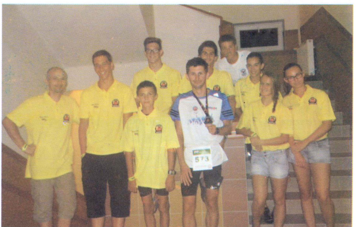
Nagyatádon, a 25. Hosszútávú Triatlon Országos Bajnokságon szép teljesítményt értek el az úszó szakosztály versenyzői. Gratulálunk!