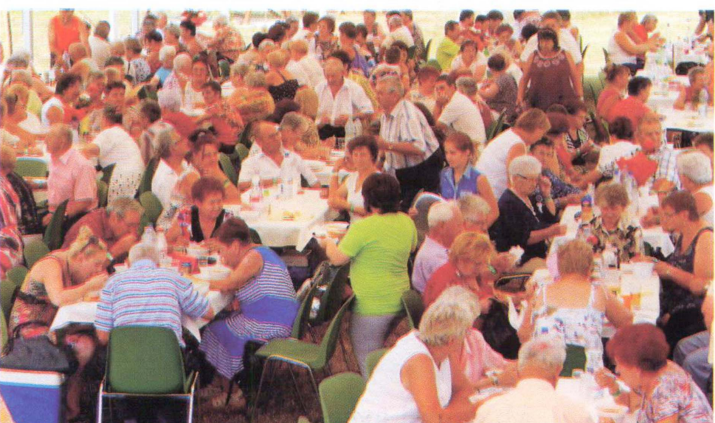
Kistérségi nyugdíjas találkozó Dévaványán