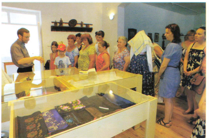
Új kiállítás nyílt a múzeumban