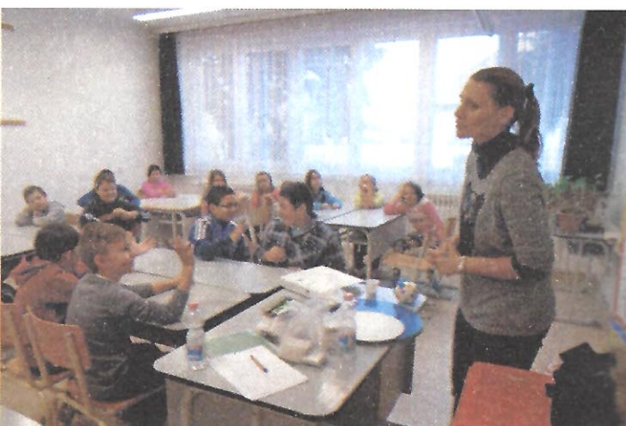
Utazó Iskola Programban vettek részt a diákok