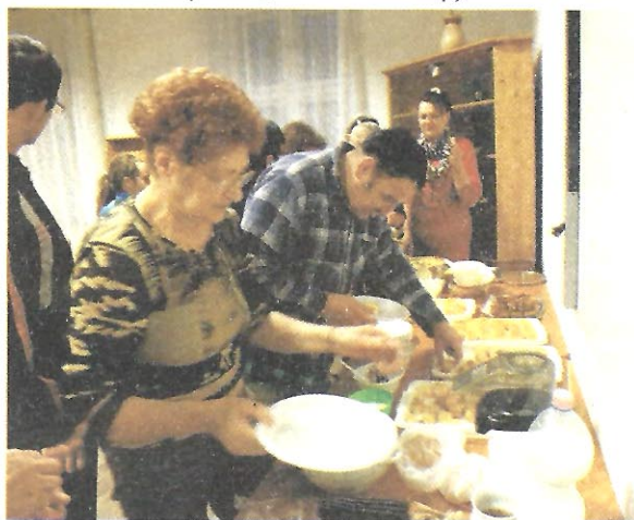
„Kukoricáztak” a múzeumbarátok köre tagjai