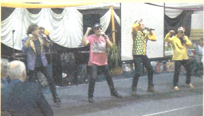
X. Óvodai alapítványi bál