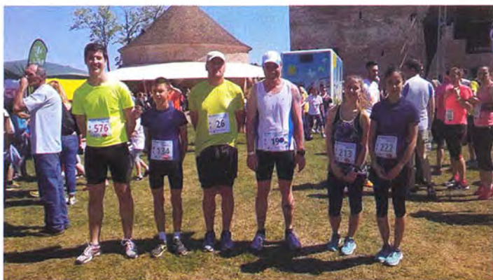
Déványai futók Gyulán jártak a VIII. Várfürdő futáson