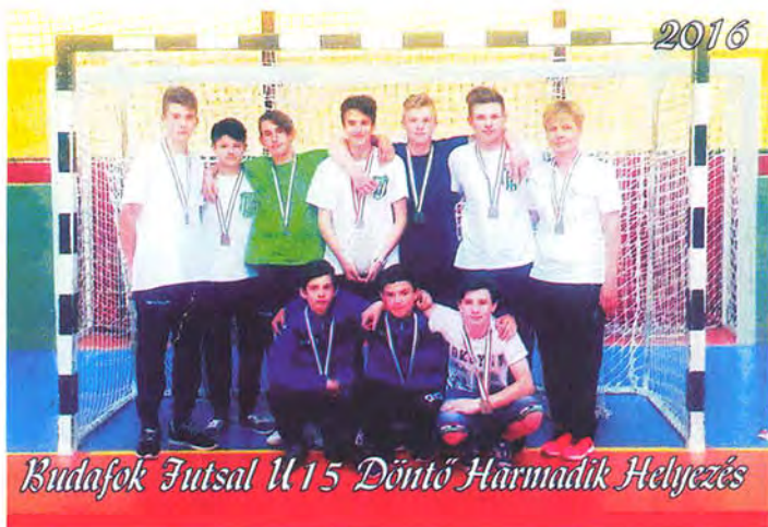
2016 Budafok Futsal U15 Döntő Harmadik Helyezés