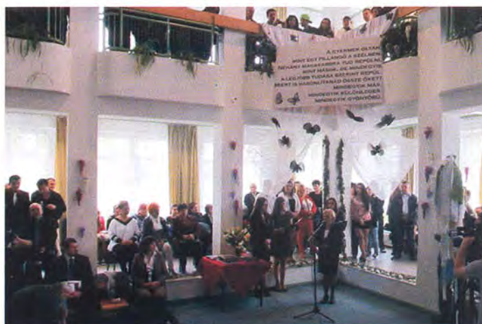
Ballagás a középiskolában