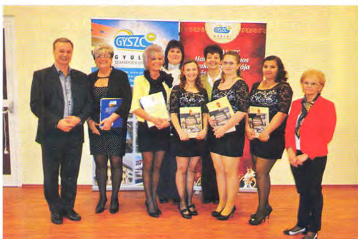
A szakma kiváló tanulója verseny győztes diákjai és oktatóik