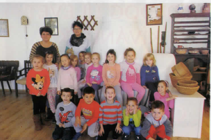
Karácsonyi készülődésre vártuk a csoportokat a múzeumba