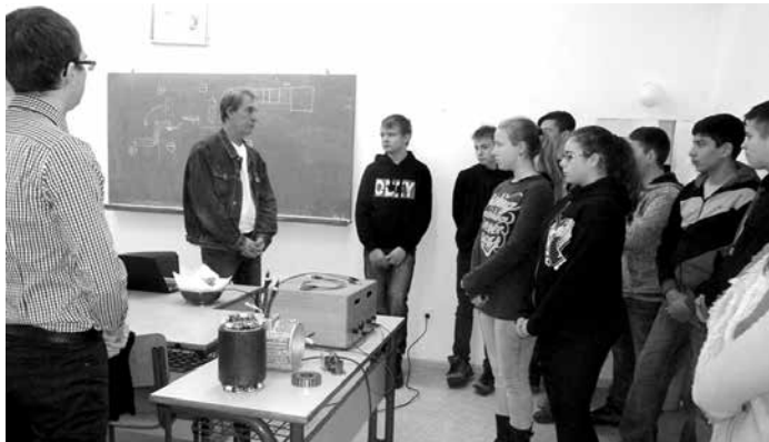
Új képzésünk, az elektromos gép- és készülékszerelő bemutatása

A szakmaszigeteken szakoktatók, szaktanárok és mi, diákok mutattuk be a szakmákat. Ismertettük a követelményeket, elhelyezkedési lehetőségeket, az ösztöndíjak feltételeit. Ezen a nyílt napon Füzesgyarmatról, Gyomaendrődről, Szeghalomról és Körösladányból érkeztek hozzánk diákok, így a kollégium is bemutatkozott. A családi légkör, a kényelem és tisztaság igen fontos,