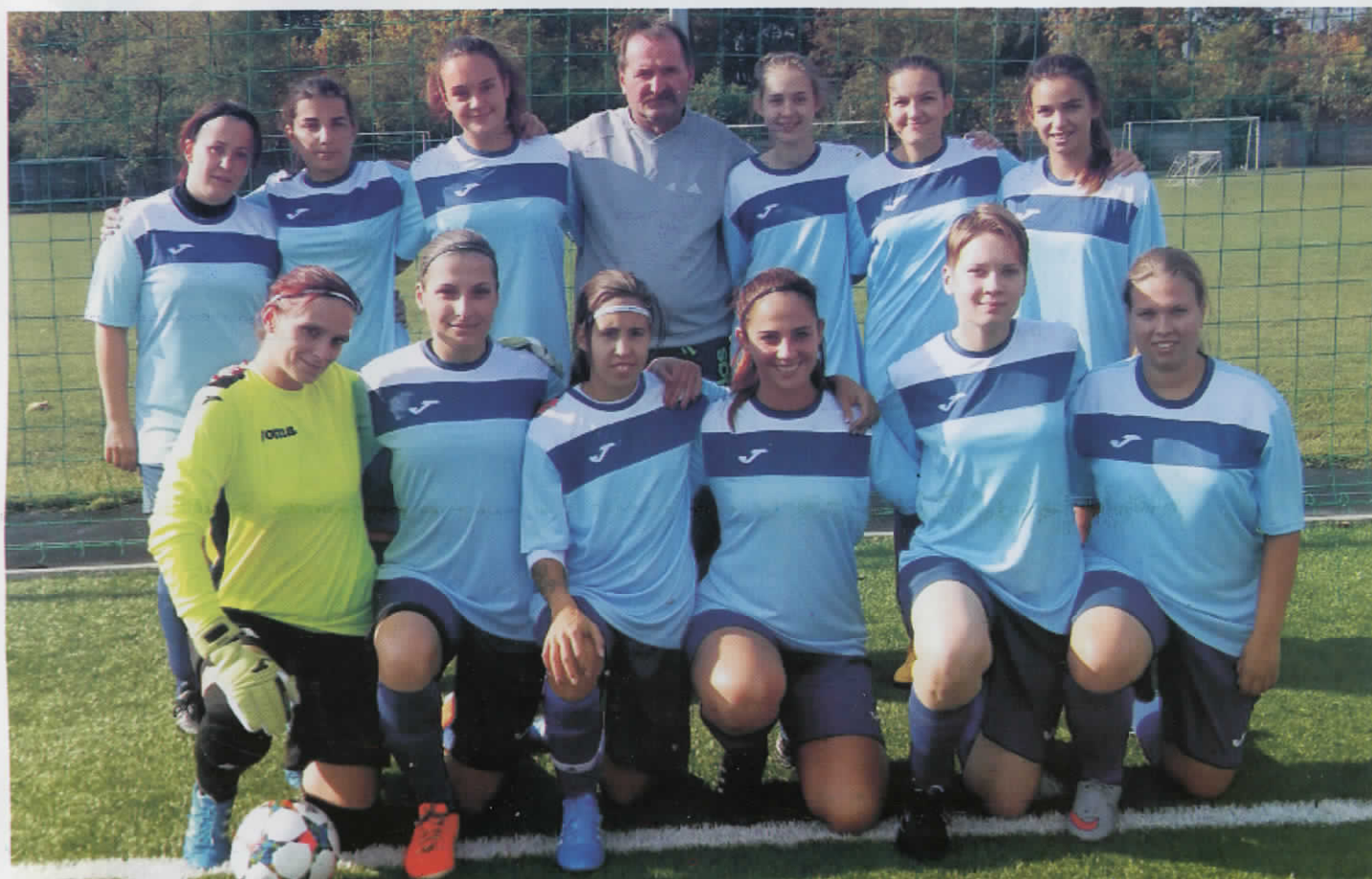
DÉVAVÁNYAI NŐI LABDARÚGÓ CSAPAT