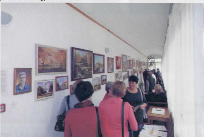
Tóth Ferenc szeghalmi alkotó festményei megtekinthetők és megvásárolhatók a múzeumban