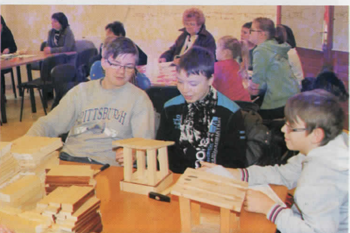
Madárkarácsony a Réhelyi Látogatóközpontban