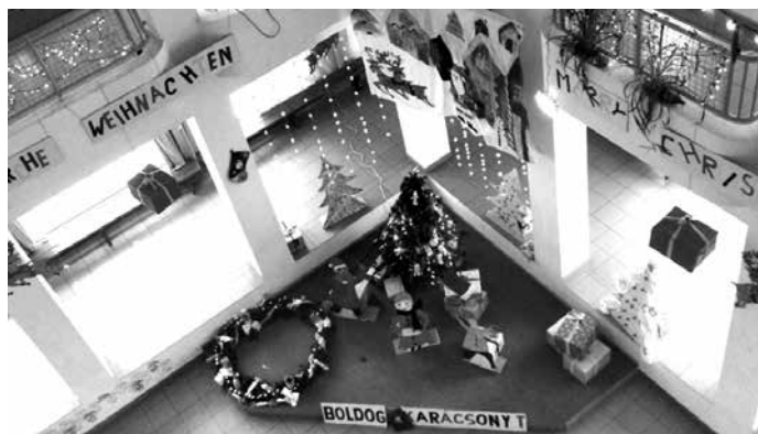
Ünnepi előkészületek: nyílt nap, Ki Mit Tud és karácsonyváras...

Mint minden évben, úgy ebben az évben is 2016. december 8-án megrendezésre került középiskolánkban a Ki mit tud...?