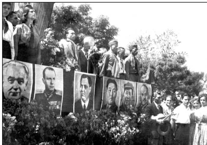
Felvonulás, 1956. május 1. (Fotóleltár 477.sz.)

Ami november 3-án még a forradalmároké volt, pár nap múlva azoké lett, akik lánctalpakkal eltiporták őket: „Hazánkban október 23-án megindult tömegmozgalom,