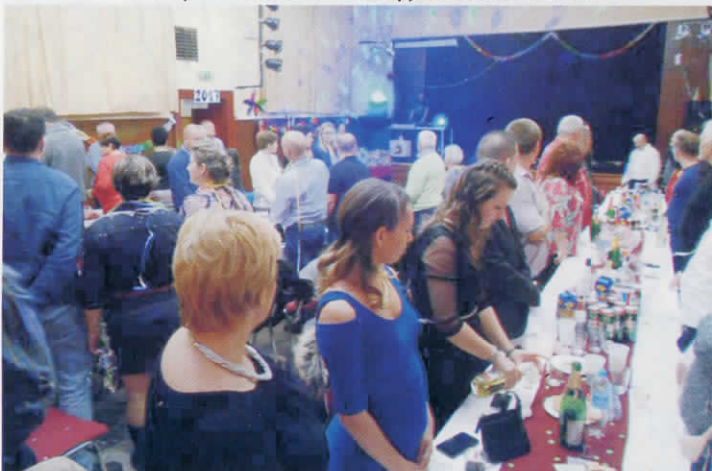
Retro szilveszter a Déványai Nagycsaládosok Egyesülete szervezésében