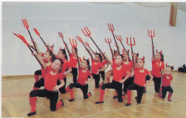
A Déványai Mazsorett Csoport tagjai Nyíregyházán jártak