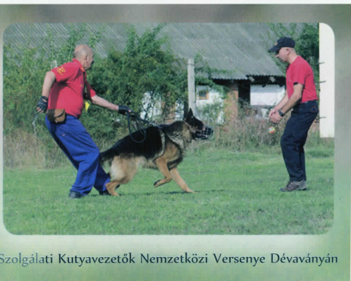
Szolgálati Kutyavezetők Nemzetközi Versenye Dévaványán