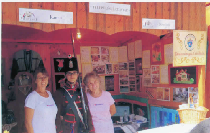
Értéktárunk bemutatása a megyenapon