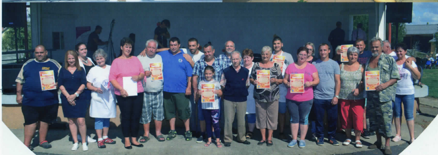
XI. Betakarítási ünnep és főzőverseny 2018. szeptember 15.