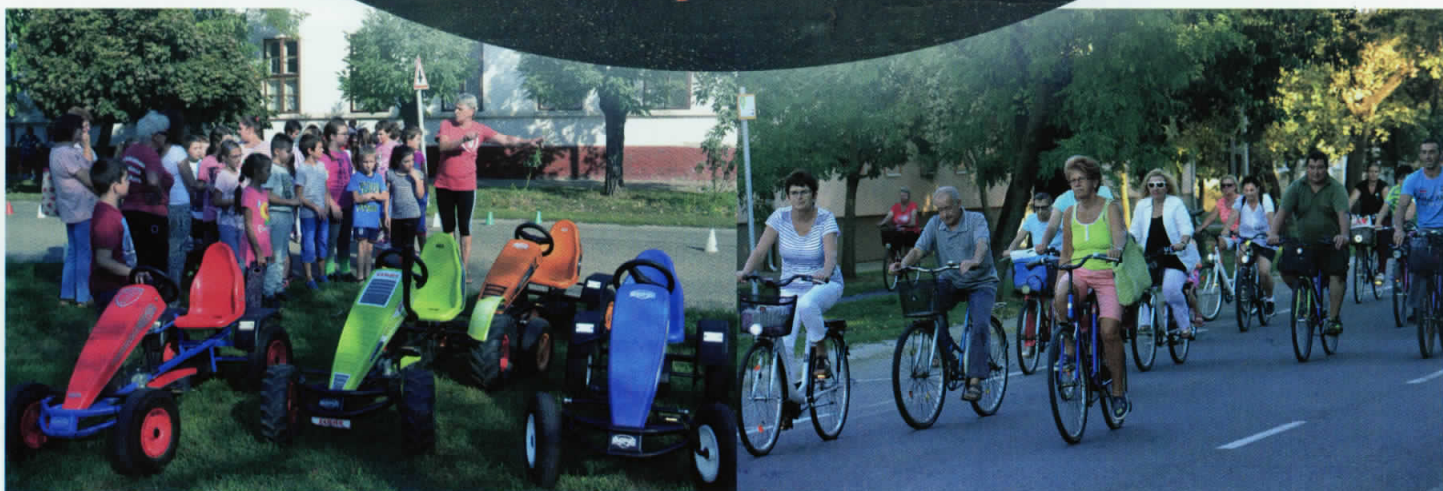
Autómentes nap - 2018. szeptember 21.