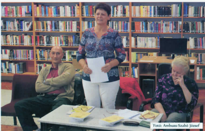
Író-olvasó találkozó a Ladányi Mihály Könyvtárban