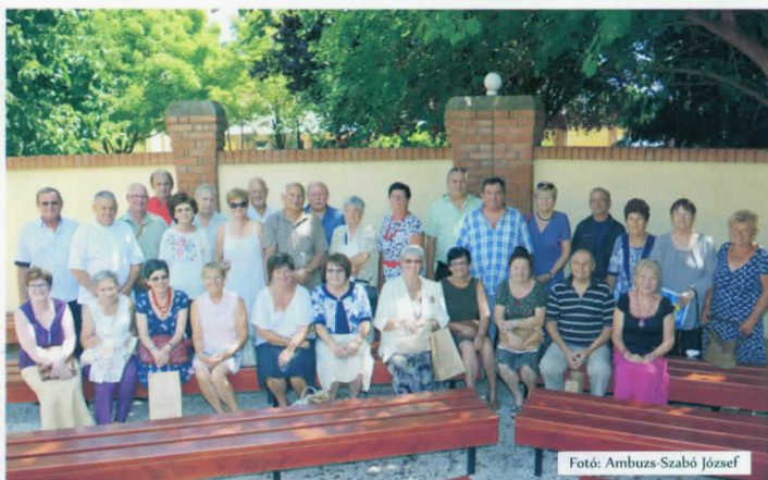
50 éves általános iskolai évfolyam találkozó