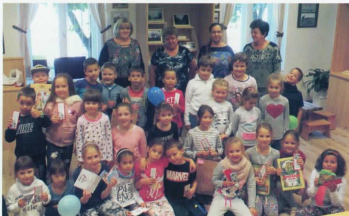
Népmese napi vetélkedő a múzeumban