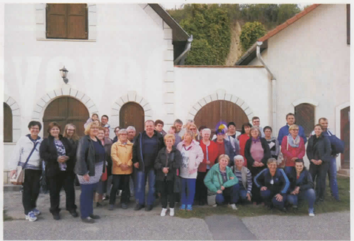
Tokajban jártak a múzeumbarátok