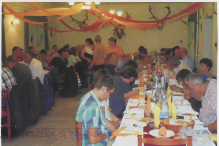
Szüreti bált rendezett a nagycsaládos egyesület