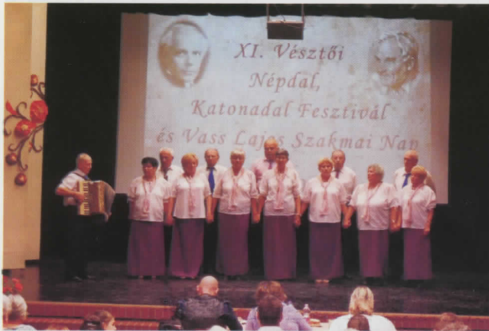
Baráti találkozón jártak a nyugdíjas egyesület tagjai