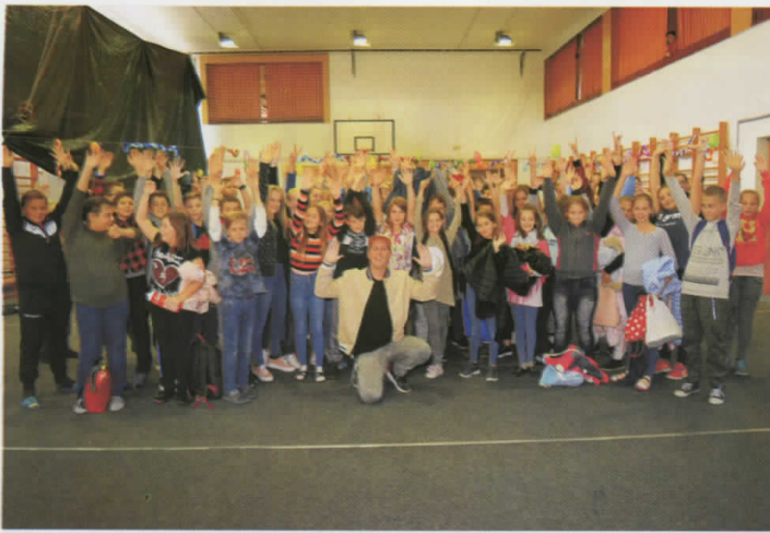
Pályaorientációs nap az általános iskolában