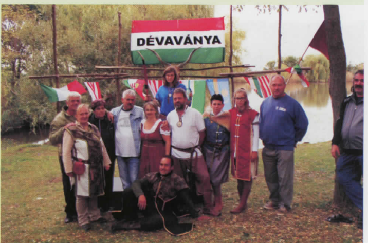
Sok résztvevővel, jó hangulatban zajlott az I. Tűzok Kupa