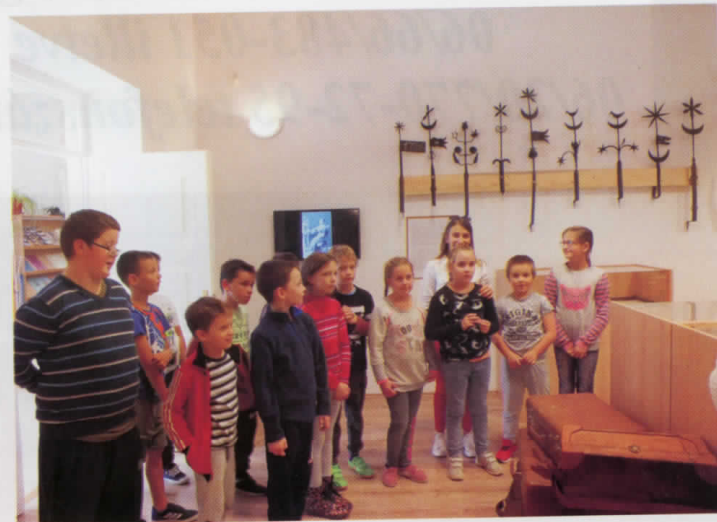
Őszi kézműves foglalkozás és „kukoricázás” a múzeumban