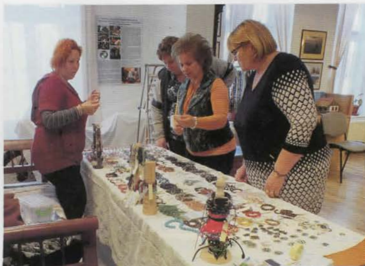
Ásványbörze és kézműves délután a múzeumban