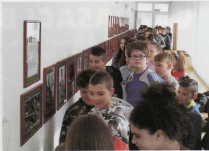
Rendhagyó történelemóra a múzeumban