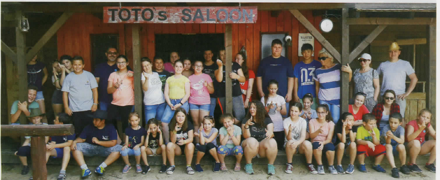
Művészeti tábor 2019