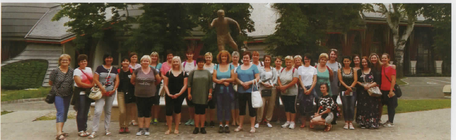
Csapatépítő kiránduláson voltak a Dévaványai Általános Művelődési Központ dolgozói.