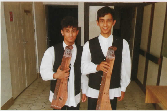
A Balogh Duó második alkalommal nyerte el az Aranypáva Nagydíjat.