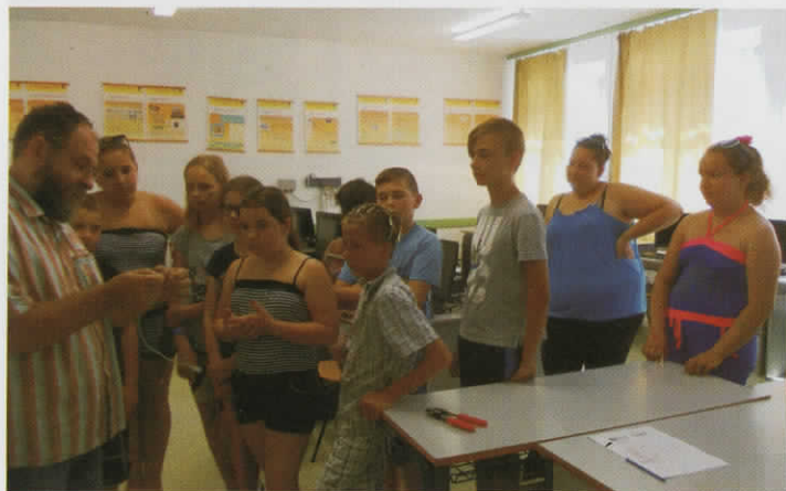
Mesterségek tábora a középiskolában