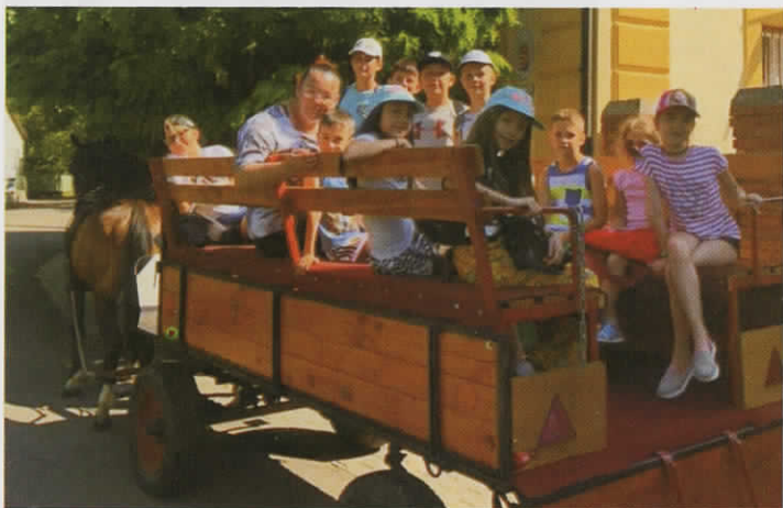
Barátság tábor 2019