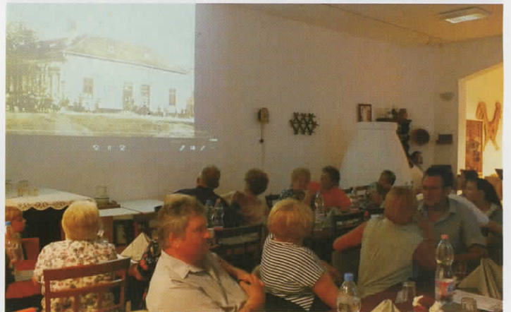
XV. Múzeumkerti est