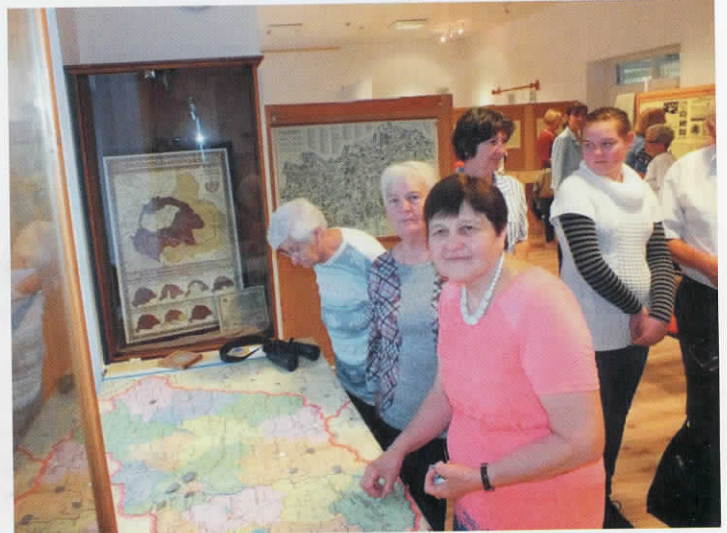
Új kiállítás nyílt a múzeumban.