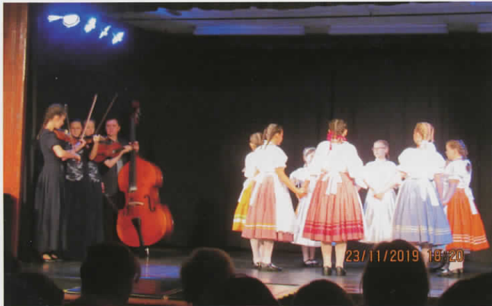
Nagy sikerrel zárult a Dévaványai Kulturális és Művészeti Alapítvány jótékonysági estje