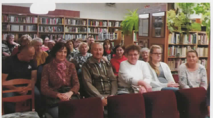
19."Környezet és egészség" c. előadás sorozat a Ladányi Mihály Könyvtárban