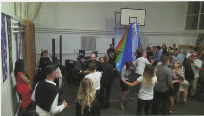
2019. november 9-én rendezték meg a Ványai Ambrus Általános Iskola Jövőjéért Alapítvány jótékonysági bálját