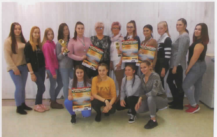
Hungarian Open Cup - 2019. november 24.