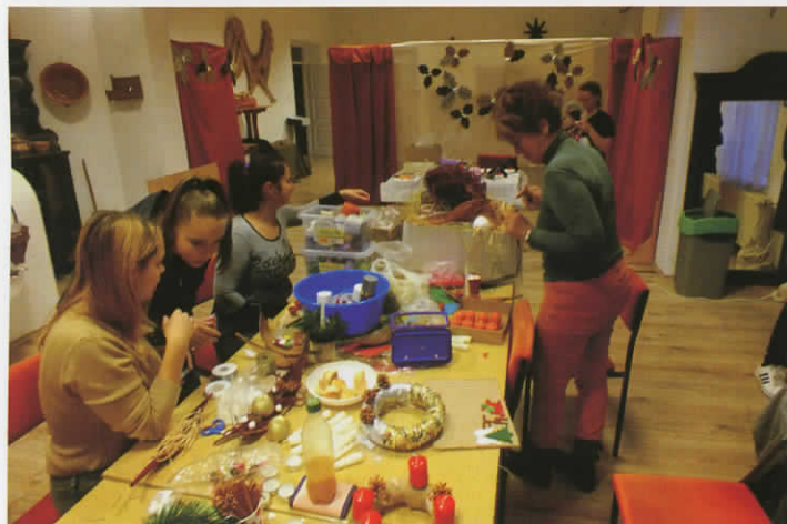
Alkotóműhely a múzeumban - 2019 november 30.