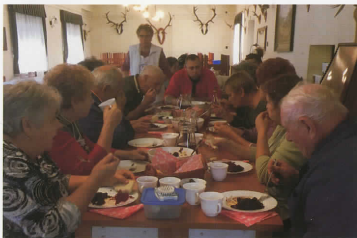
Retro disznótör a Hagyományörző Nők Egyesületénél