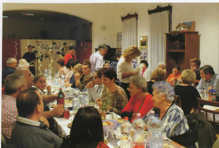
Batyus bál - 2019. november 22.