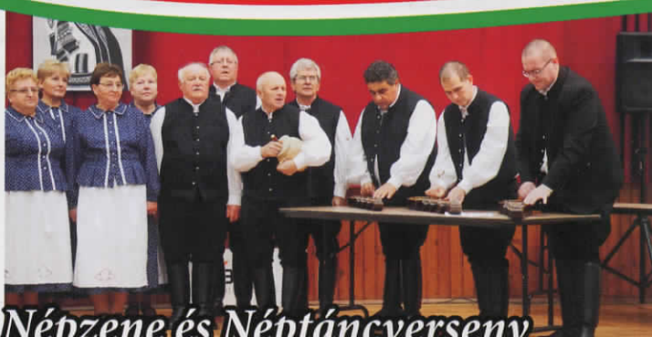
IX. Kádár Ferenc Országos Népzene és Néptáncverseny