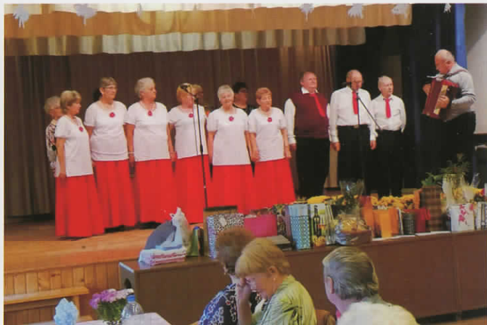
Az Őszi Napfény Nyugdíjas Egyesület fellépése Köröstarcsán