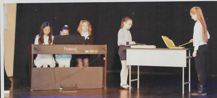
Meghitt hangulatban vártuk az ünnepeket a dévaványai gyermekek művészeti produkcióinak segítségével, a Ványai Ambrus Általános Iskola és Alapfokú Művészeti Iskolában.