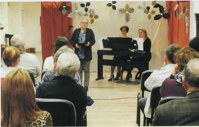
30 éve indult újra a Dévaványai Hírlap.