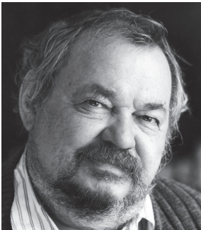
Lázár Ervin 1936-2006.

1. A versenyt az eddigi hagyományoknak megfele- lően a Dévaványai Múzeumbarátok Köre és a DÁMK Bereczki Imre Helytörténeti Gyűjtemény hirdeti meg.