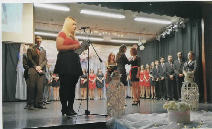
Szalagavató - 2019.