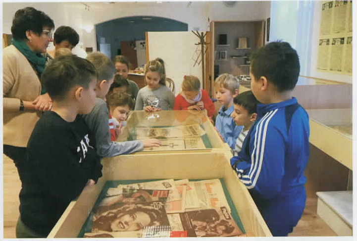
Sokan ellátogattak az év végi múzeumi foglalkozásokra.