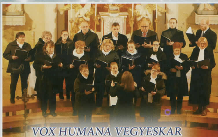
VOX HUMANA VEGYESKAR KARÁCSONYI KONCERTJE