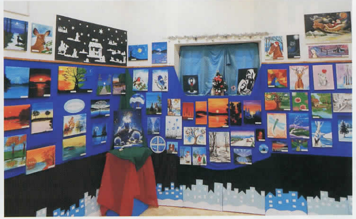
A festészet tanszak téli kiállítása.