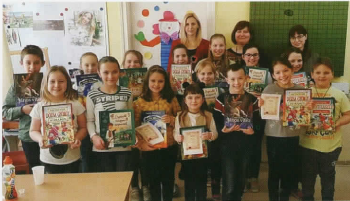
Vers-és mesemondó délután a Ványai Ambrus Általános Iskola és AMI alsó tagozatán