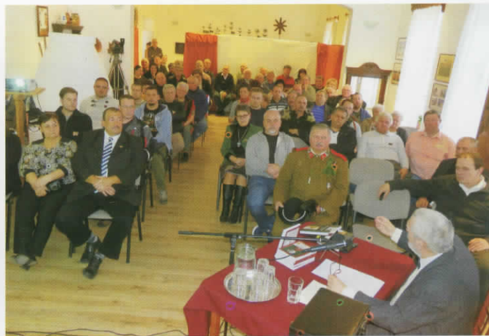
A Déványai Múzeumbarátok Körének éves közgyűlése