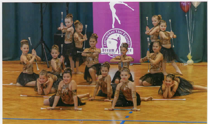
Az idei Szolnok Open Országos Mazsorett Versenyen show tánc, gyermek kategóriában az Ametiszt csoport I. helyezést ért el, míg az Elixír csoport II. helyezett lett. Gratulálunk!