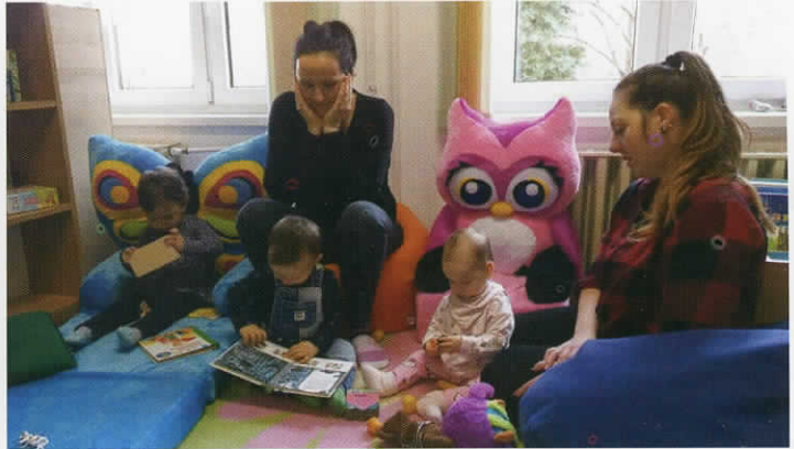
Baba-mama klub a Ladányi Mihály Könyvtárban