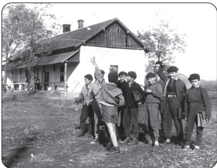
Diákok csoportja a Vásártéri cédulaháznál, 1963.

Pünkösöd neve a görög pentekosztész (ötvenedik) szóból származik, ugyanis ez az ünnep a húsvétot követő ötvenedik napon kezdődik. Mozgó ünnep, a húsvét után május 10. és június 13. között. A zsidó vallásból ered, ahol a pészach utáni ötvenedik napon az aratás, az első gyümölcsök, majd a tíz parancsolat adományozásának ünnepét ülték. A keresztény egyház annak emlékére tartja, hogy tanai szerint Jézus mennybemenetele után a Szentlélek leszállt az apostolokra. A magyar pünkösdi szokások a keresztény ünnephez kapcsolódnak, bár vannak tiltó rendelkezések is, amelyek a király választáshoz, pünkösdi királynéjáráshoz, tánchoz és játékok tiltásához kötődnek.