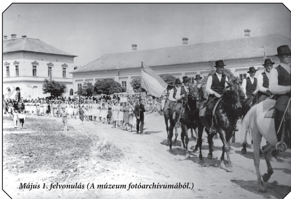
Május 1. felvonulás