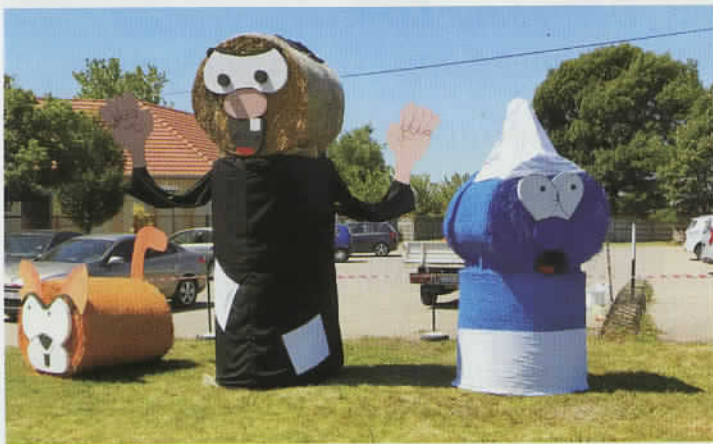
Mesefigurás installációk várják a gyerekeket városunkban!