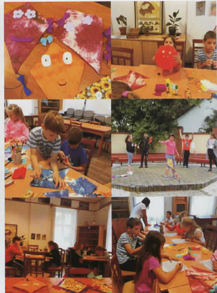
Nyári kézműves foglalkozások a múzeumban

Július 1-én megnyitotta kapuit a Strandfürdő, nagy örömkre ezzel egy időben a tábor is üzemel. Kezdődjön az igazi strandszezon! Várunk mindenkit sok szeretettel!