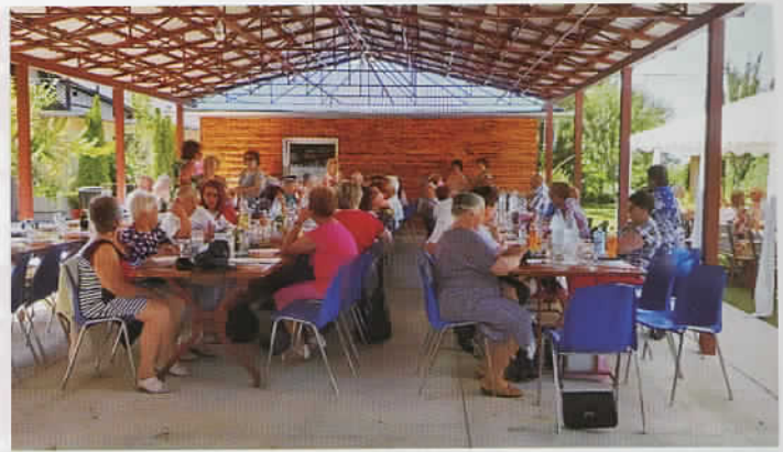
Baráti találkozó hat település nyugdíjasaival