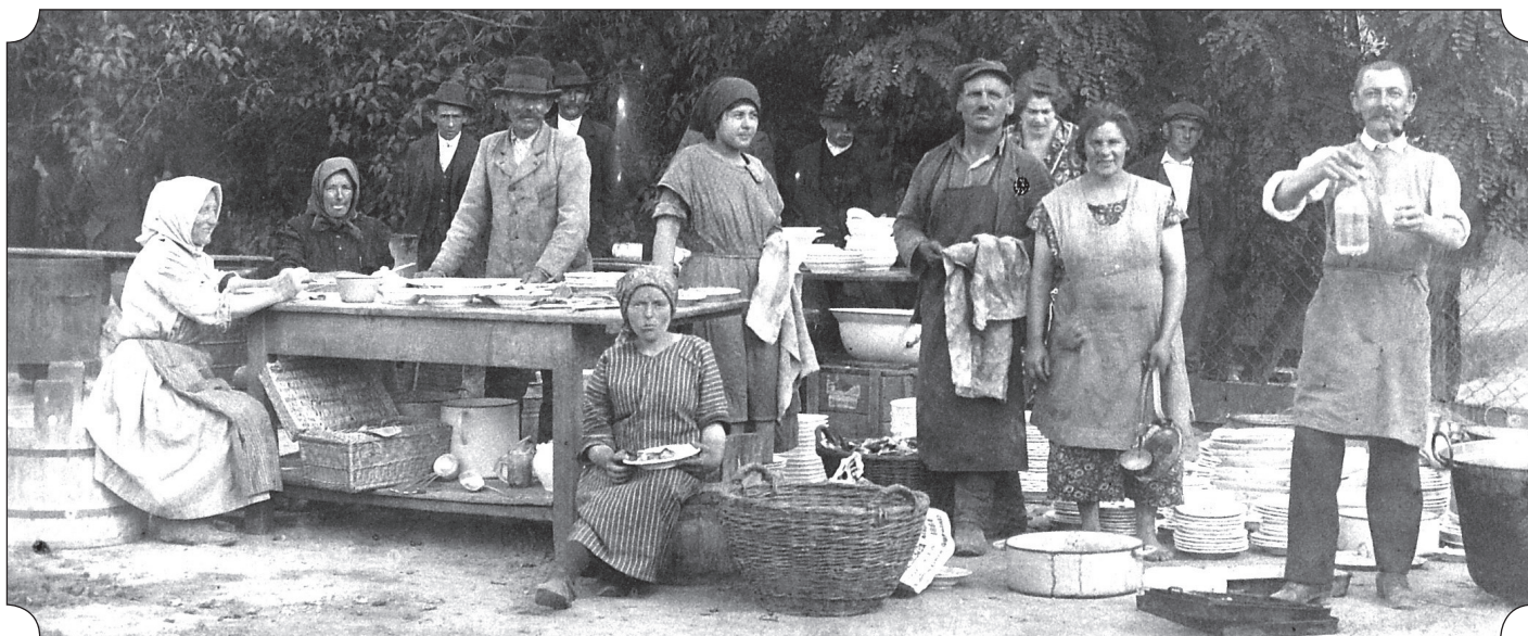
Lakodalmi készülődés. a BIHGY archívumából