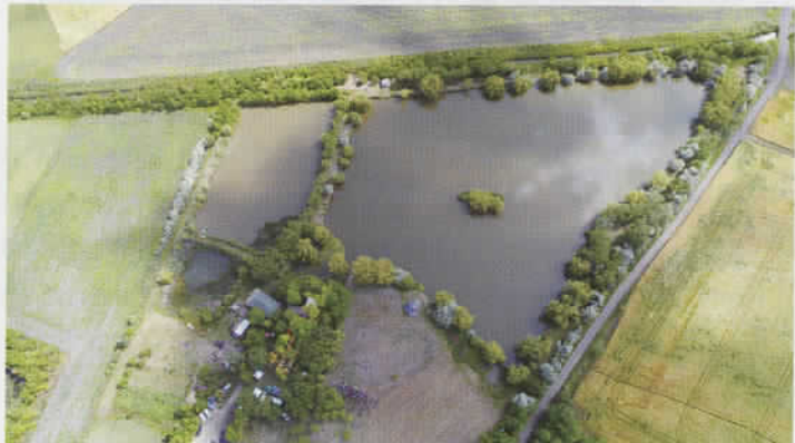
III. Hagyományörző íjászverseny a Túskevár halastónál