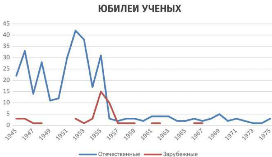
Рис.3. Количественные данные о празднуемых юбилеях ученых (с 1945 по 1975 гг.)

Избранная нами юбилейная линза позволила представить антропологический образ советской науки и ученого, транслируемый посредством журнальной периодики, хотя работа в этом направлении еще не завершена. На основании анализа статейного репертуара трех журналов удалось выявить динамику юбилейных мероприятий, посвященных отдельным ученым (см. рис. 3).