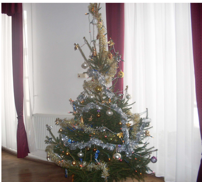
Az Önkormányzat Karácsonyfája a Községháza nagytermében