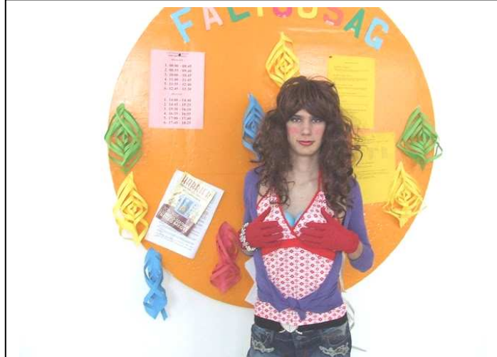
Egy lány vagyok ... Vagy még is inkább fiú!?