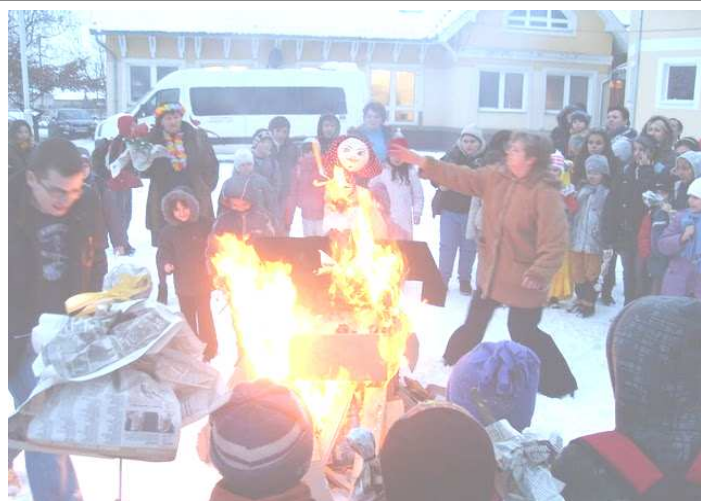
A kiszabábu égetése

Herczkuné Magyar Andrea & Mányákné Gönczi Ilona ©