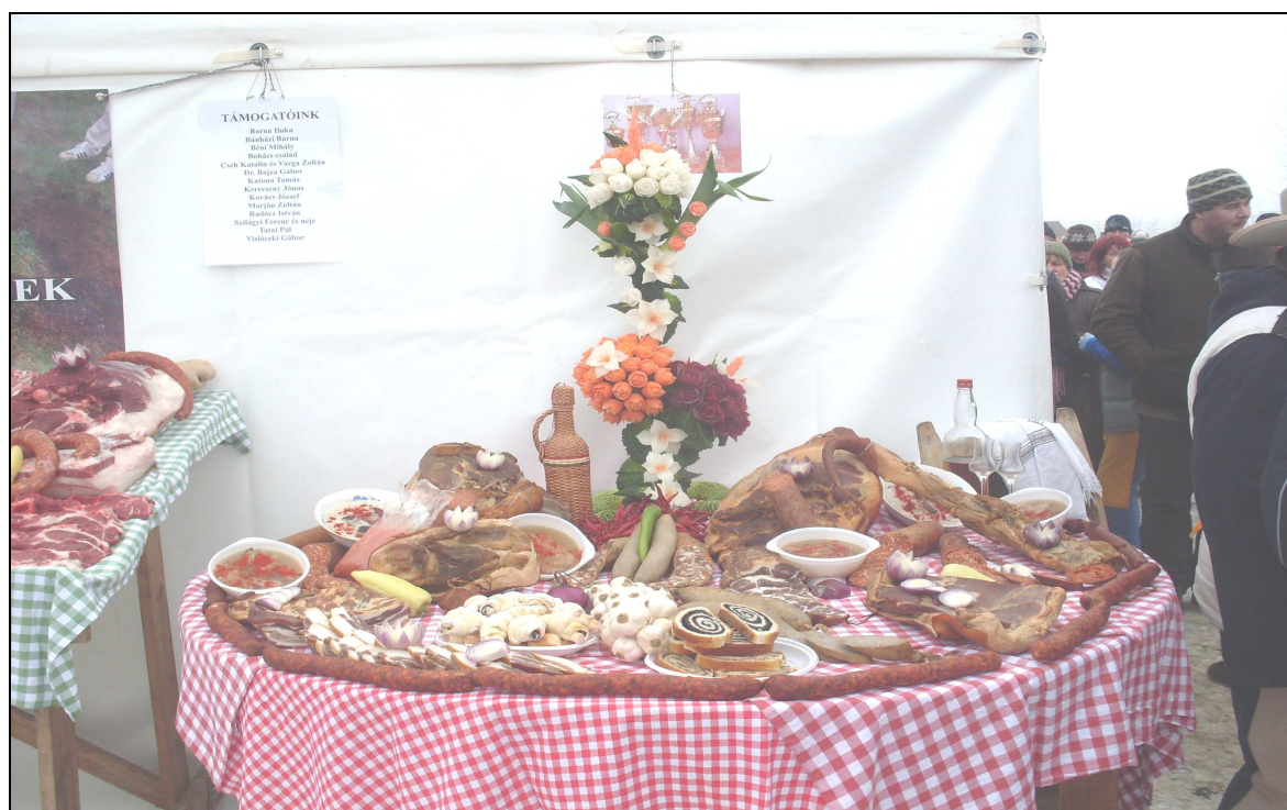
A legszebb porta egyik éke a szépen terített asztal volt