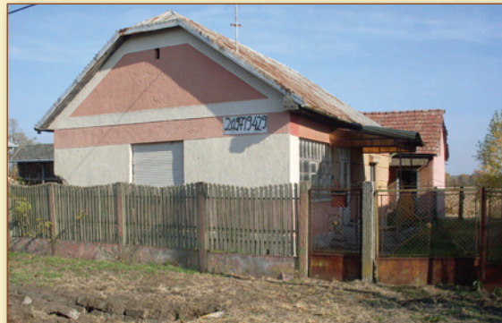
A megvásárolt ingatlan jelenlegi állapotában

Az önkormányzat a szeptember 29-i rendkívüli ülésén a Biri, Mező Imre utca 18. szám alatti ingatlan megvásárlásáról döntött. A 1,5 millió forintért megvásárolt, romos állapotban lévő lakóházat a képviselő-testület pályázatokból megvalósuló építési beruházások helyszínének szánja.