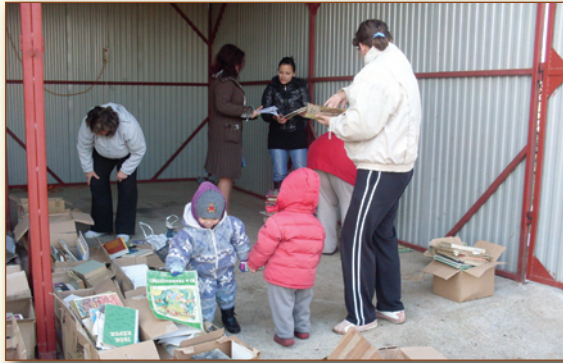
Az első érdeklődők

A selejtezés következtében 1106 darab könyv került ki az állományból, melyek közül – október 28-án délután – ingyenesen válogathattak az érdeklődő birisi lakosok.