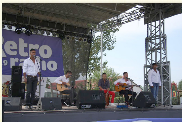
A Ham Ko Ham