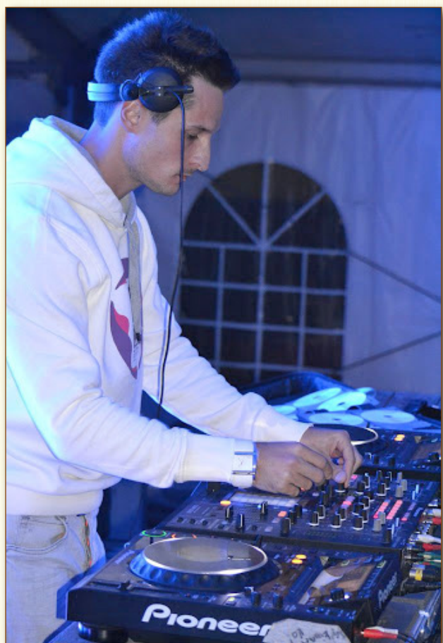
A Party Sátorban