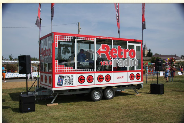
A fesztiválról élőben közvetítő Retro Rádió