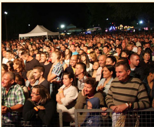
... és este.