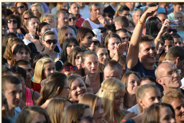
A nézők egy csoportja napközben ...