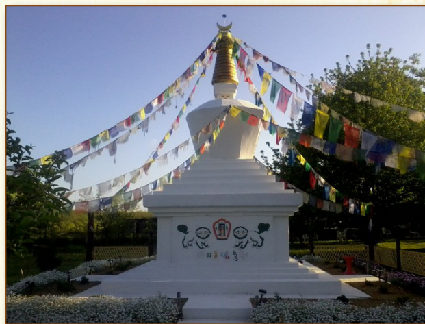
A Biri, Táncsics-telepi Sztúpa

2007 tavaszán jártam először, az akkor még polgárháborútól sújtott Himalájai országban, Nepálban. Utam során rengeteg élményt szereztem abból a szeretetből és boldogságból, amit a szűkös anyagi világukban élő nepáliak megosztottak velünk. Nagy hatással volt rám a buddhista kolostorok építészeti harmóniája, és a szinte minden sarkon fellelhető Sztúpa erdő. Katmanduban a nepáli fővárosban döntöttem el, barátommal és fogadott testvéremmel, hogy mi itthon a rohanó világunkban építünk egy Sztúpát Buddha és a Darma tiszteletére. Egy kis szigetet képzelünk el hazánkban, egy kis Tibetet, a nyugalom, a béke, a szeretet és az együttérzés szimbólumát.