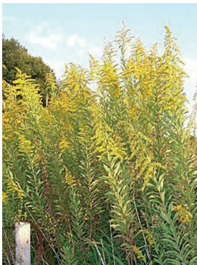
Orvosi székfű, avagy kamilla

Az orvosi székfű vagy ismertebb nevén kamilla mindenhol előfordul hazánkban, de legnagyobb tömegben az Alföld szikes területein terem. Virágzásával egy időben több más hasonló küllemű növény is virágzik (pipitér, székfűfajok), de ezektől egyértelműen megkülönböztethető jellegzetes illata, fonalszerű levele és virágzatának üreges, kúp alakú vacokrésze alapján. Virágzatát akkor érdemes gyűjteni, amikor csöves virágai már sárgák, a fehér színű sugárvirágai pedig vízszintesen állnak.